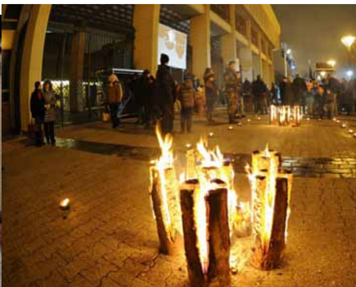
Atminimo liepsna niekada neužges