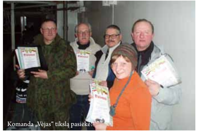
Komanda „Vėjas“ tikslą pasiekė!