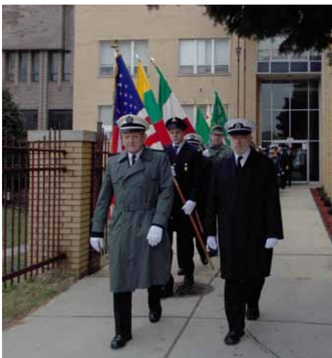
Čikagos šauliai Sausio 13-ąją atidavė pagarbą už laisvę kovojusiems broliams ir sesėms