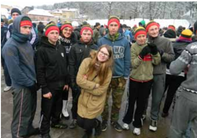
Sausio 13-osios pagarbos bėgimas – mūsų bežodė nuostata

Bėgant 9 km pritrūksta kvapo, bet jėgas ir gerą nuotaiką palaiko prisiminimas, dėl ko bėgame. Bėgimą pa-