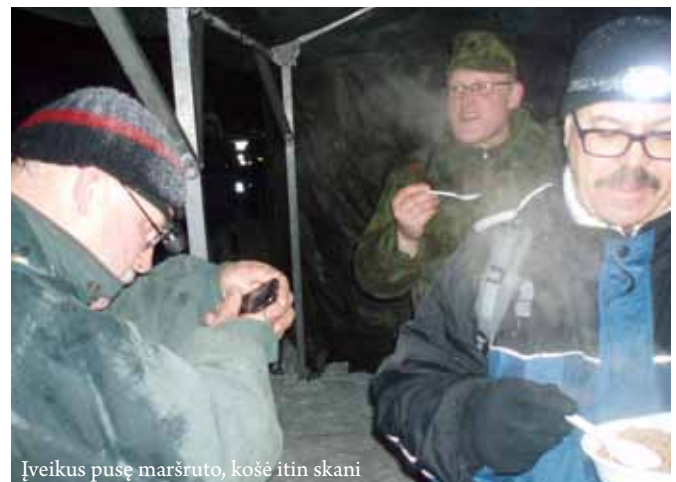
Įveikus pusę maršruto, košė itin skani

Žygiuodami miesto gatvėmis pasukome į dešinę prie netoliese esančio paminklo senosios Priekulės bažnyčiai