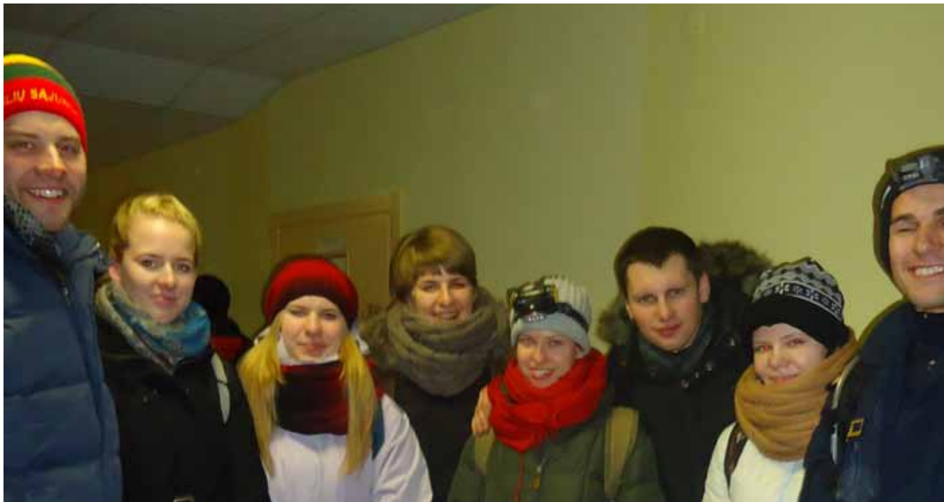
Lietuvos šaulių studentų korporacijos SAJA nariai prie Klaipėdos sukilimo paminklo 2013 m.