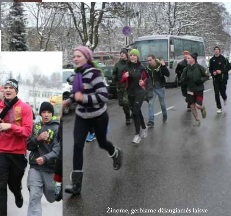
Žinome, gerbiame džiaugiamės laisve