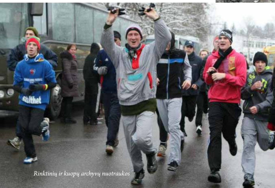
Rinktinių ir kuopų archyvų nuotraukos