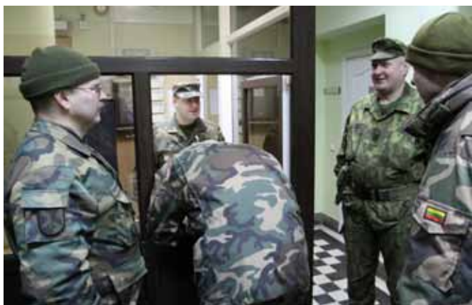
Prieš išvykstant į tarnybos vietą būtina pasirašyti reikiamuose žurnaluose

metų ir ten dirbančius karius pažįsta asmeniškai.