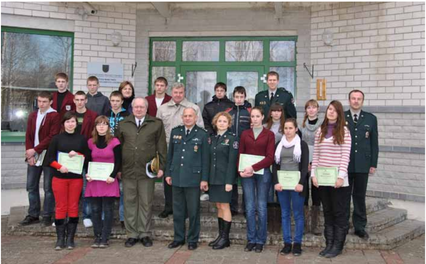
Tą dieną bibliotekoje atsiminimų nestigo

Sausio pradžia – tai Lietuvos laisvės gynėjų laikas susitikti, susitikti ten, kur kažkada suvedė likimas, susitikti ten, kur 1991-aisiais šaukė pareiga. Pareiga Tėvynei, motinoms, šeimoms.“