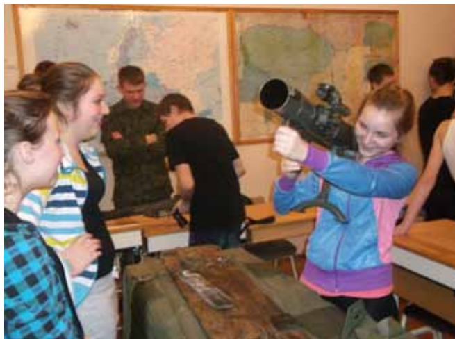
Ginklus ne tik galėjome palaikyti rankose, bet ir pabandyti išardyti, vėl surinkti.

Tauragės apskr. LDK Kęstučio 7-osios šaulių rinktinės Laukuvos šaulių 2-ojo būrio jaunoji šaulė