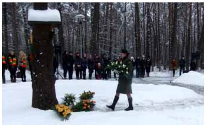
Prie koplytstulpio sužydo gėlės

Alytuje vykęs Laisvės gynėjų dienos minėjimas prasidėjo susikaupimu ir maldomis už Tėvynę, laisvę ir nepriklausomybę. Po šv. Mišių didelė karių, savanorių bei šaulių rikiuotė, vedama karinio orkestro, žygiavo Alytaus miesto gatvėmis. Miesto parke, prie medinio kryžiaus, skirto 1991-ųjų sausio 13-osios aukoms atminti,