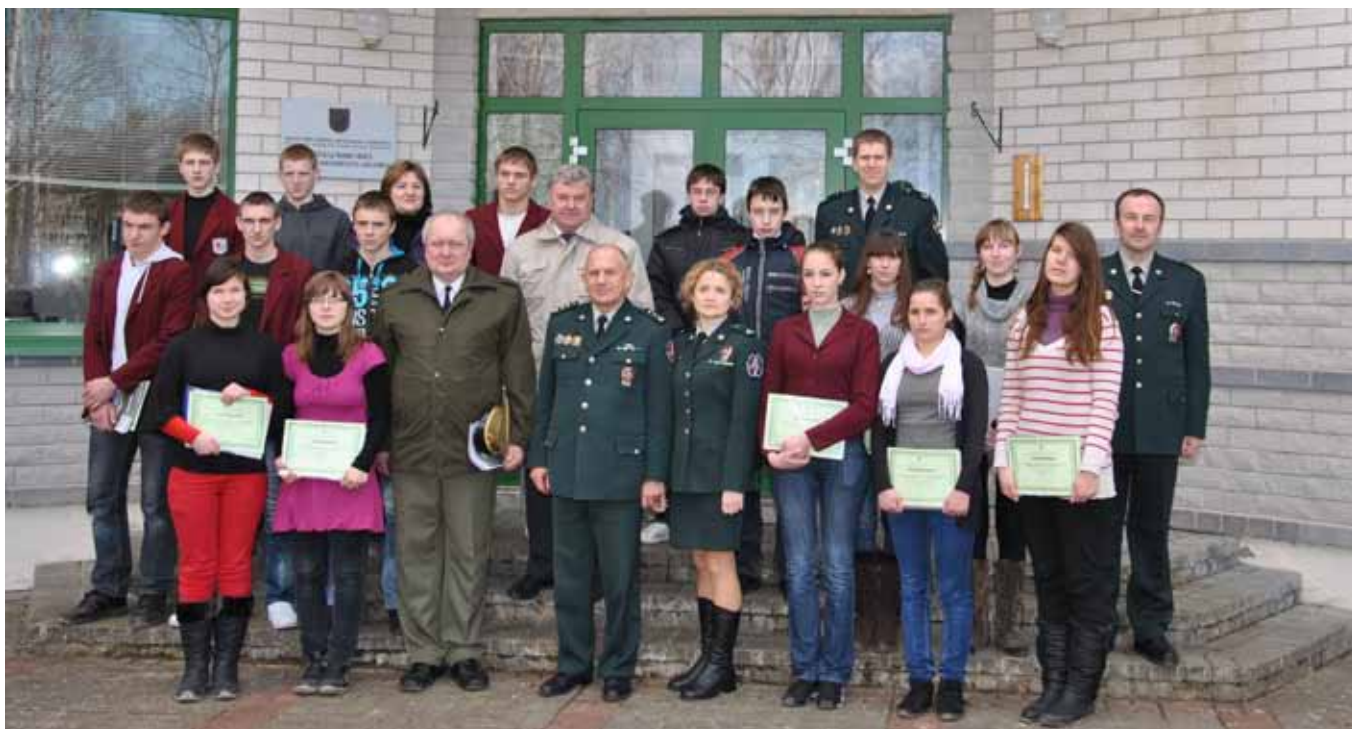
2012 m. kovo 14 d. Pagėgių rinktinės Kudirkos Naumiesčio pasienio užkardoje iškilmingai pažymėta čia įkurto „Jaunojo pasieniečio“ būrelio veiklos pradžia

Išsamesnė informacija apie Pagėgių rinktinės Kudirkos Naumiesčio užkardos „Jaunojo pasieniečio“ būrelio veiklą – www.vkudirkosgimnazija.lt