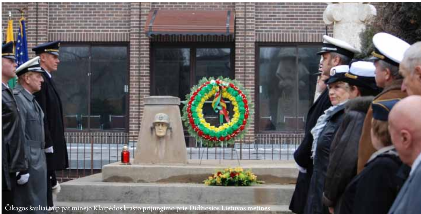
Čikagos šauliai taip pat minėjo Klaipėdos krašto prijungimo prie Didžiosios Lietuvos metines