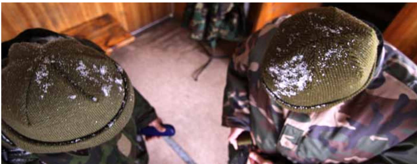
Ar sniegas, ar lietus – šauliai nuolat patruliuoja

Taigi „Objekto Nr. 1“ apsauga – šaulių rūpestis. Jei kada ten vyksite, prie kontrolės ir praleidimo punkto jus pasitiks šaulys ir maloniai paprašys reikiamų dokumentų. Šis objektas – bene ilgiausiai saugomas šaulių. Kai kurie ten tarnaujantys šauliai savo „karjerą“ skaičiuoja dešimtėmis