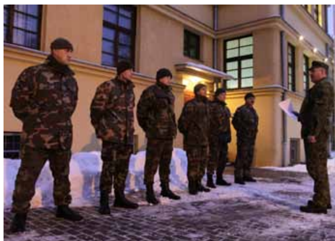
Tiesiog ankstyvo ryto instruktažas