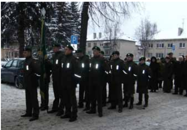
Miesto gatvėmis žygiavome, kaip dera šauliams

iškilmingai sugiedojome Lietuvos himną, tylos minute pagerbėme žuvusiuosius, uždegėme žvakeles, padėjome gėlių. Alytaus moksleiviai maironiečiai parengė nuostabią meninę programą „Sausio 13-oji“, skambėjo laisvės dainos ir eilėraščiai.