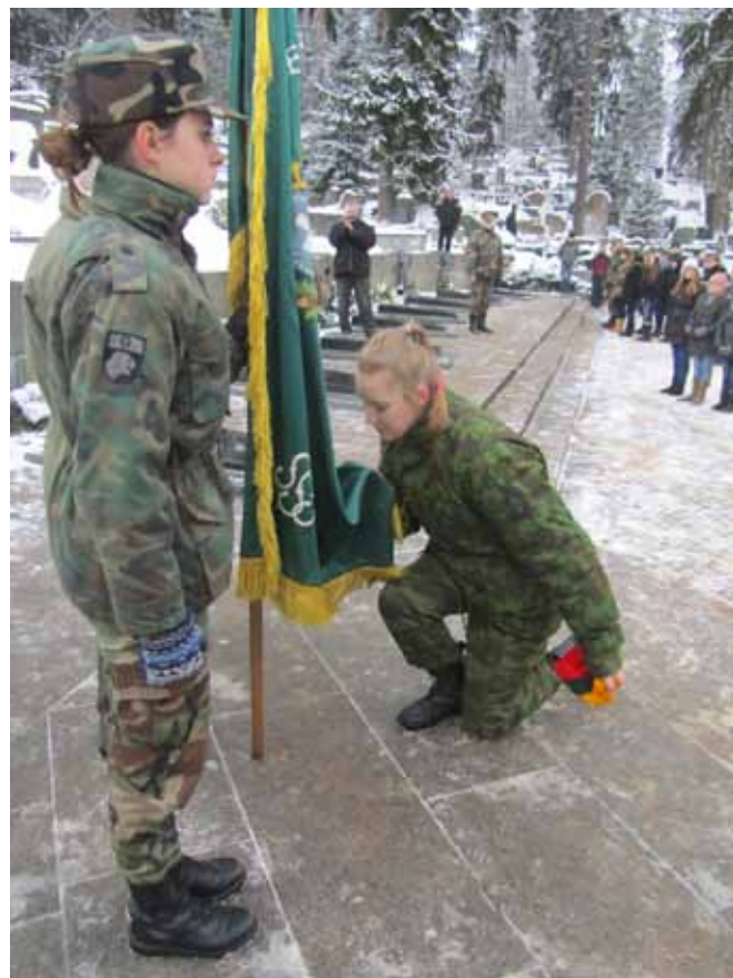
Tokią dieną tapti jaunąja šaule – garbė

„Prieš bėgimo „Gyvybės ir mirties keliu“ startą Utenos apskrities šaulių 9-osios rinktinės šauliai rinkosi prie memorialo, kur pagal tradiciją kandidatai į jaunuosius šaulius iškilmingai pasižadėjo būti atsakingi ir narsūs