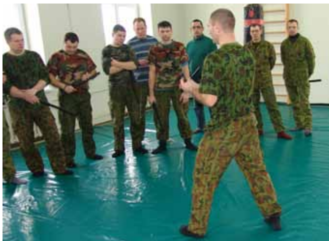
Klaipėdiškiai šauliai mokosi naudoti specialiąsias priemones