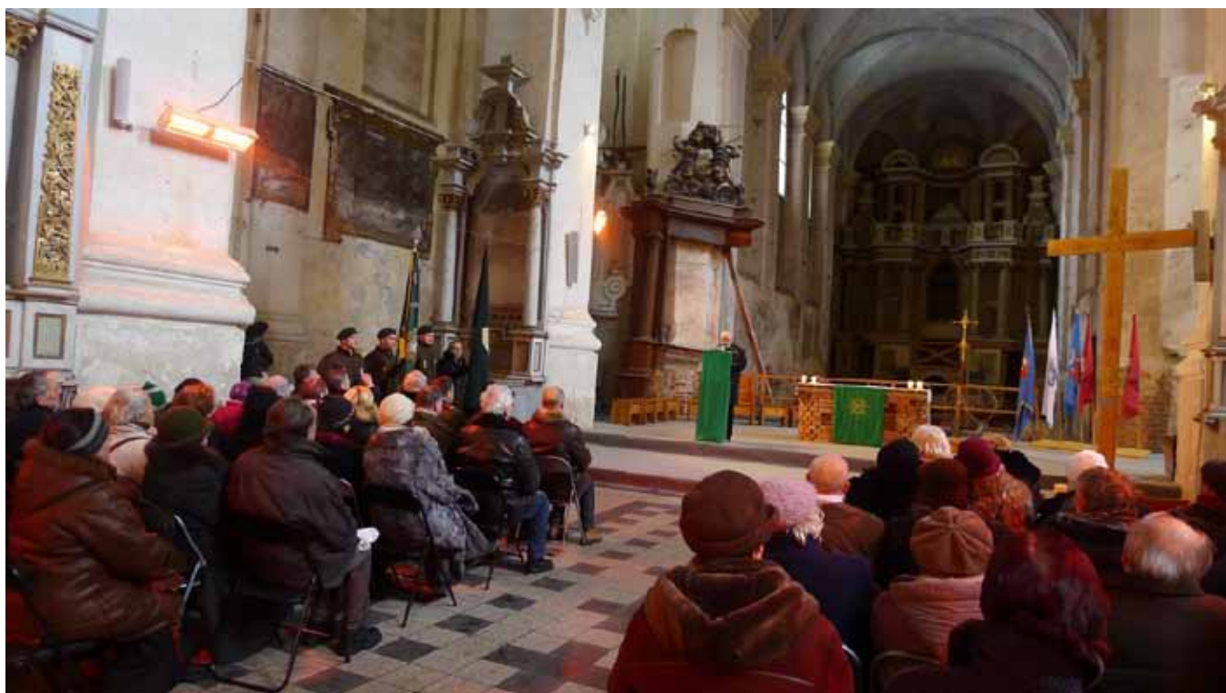
Šv. Jurgio Kankinio bažnyčios skliautai klausė priesaikos žodžių, pasvarstymų apie laisvę, tikėjimą, pareigą...

Kauno apskr. Vytauto Didžiojo šaulių 2-osios rinktinės šauliai