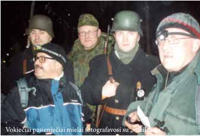
Vokiečiai pasieniečiai mielai fotografavosi su „sukilėliais“