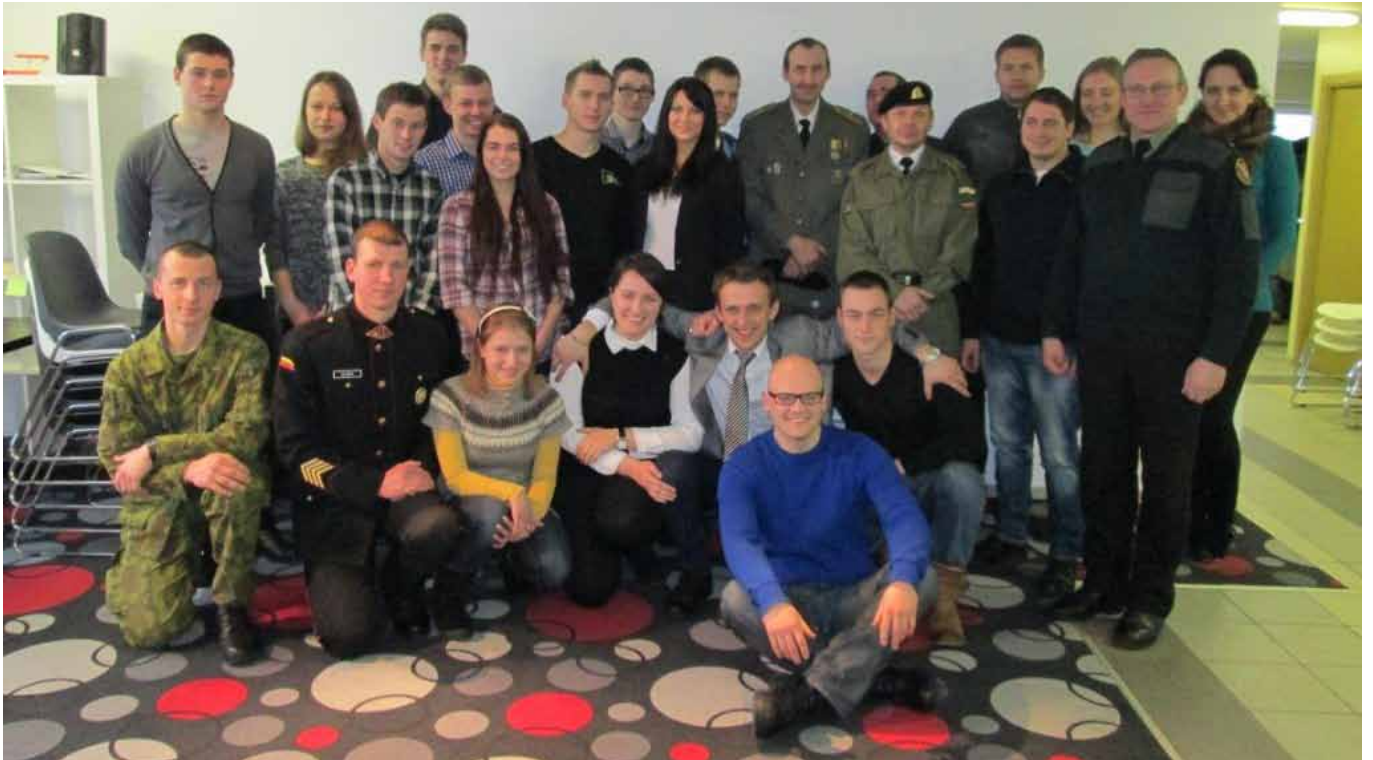
Visi diskusijos dalyviai pareiškė tvirtai apsisprendę ginti Tėvynę įvairiomis priemonėmis, jeigu nepriklausomybei iškilų grėsmė ar pavojus ją prarasti

Man labai sudėtinga kalbėti apie Lietuvos laisvės gynėjų dieną, kadangi nesu patyrusi to, ką patyrė žmonės, budėję prie Aukščiausiosios Tarybos, Vilniaus televizijos bokšto, Lietuvos radijo ir televizijos ar kitų tomis dienomis visai valstybei reikšmingų pastatų. Iš tėčio ir mokytojų pasakojimų žinau, kad nepriklausomybė – tai beginklių žmonių pasiekta pergalė. Tai dienos ir naktys, kuomet prie