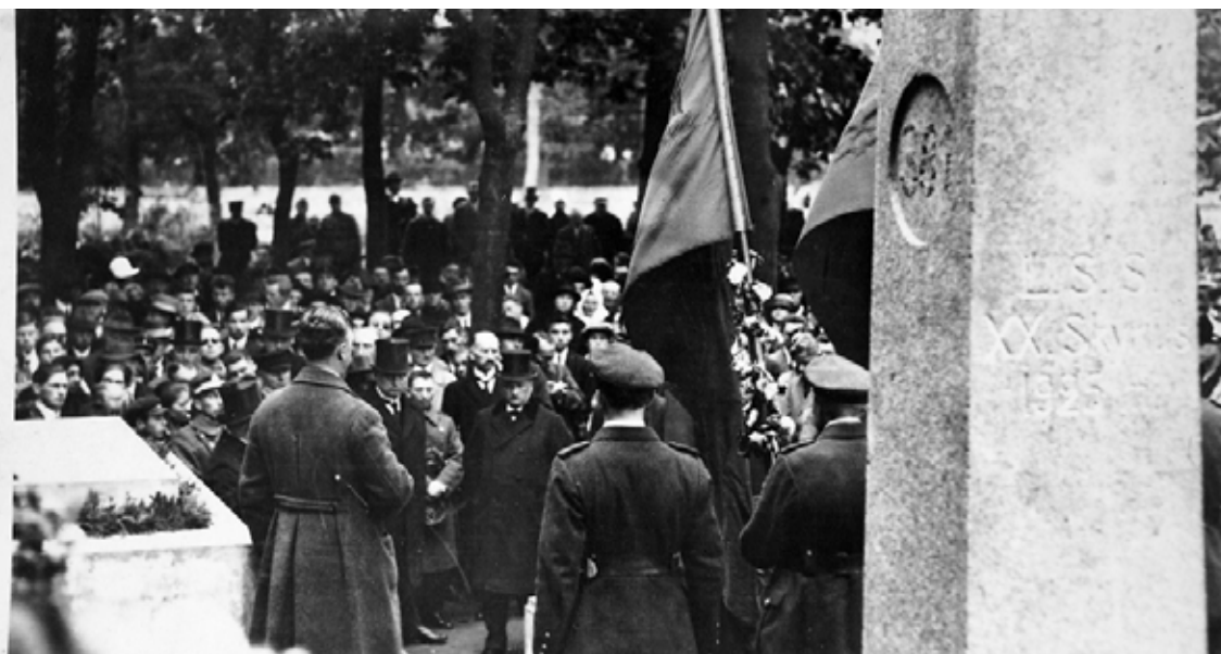
Iškilmų metu Klaipėdoje prie paminklo 1923 m. sukilimui. Paminklo galinėje pusėje iškaltas užrašas: „LCVA. P-23911 B 3, P-23906 B 3.“