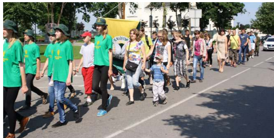
Šventės dalyvių eisena traukia į stadioną

Šaulio dienos renginius pajavairino šventės partneriai. Nelengvas rungtis, estafetes, įvairiausias varžytuves jauniesiems šauliams parengė Tauragės apskrities vyriausiojo policijos komi-