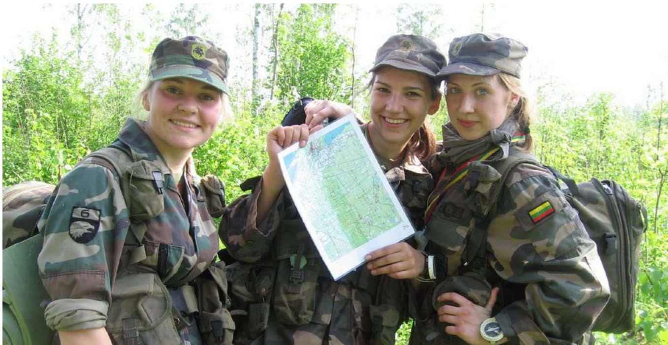
Lengva nebuvo, tačiau ir kitą syk viską kartotume iš naujo...

Šiaulių apskr. gen. P. Plechavičiaus šaulių 6-osios rinktinės Gruzdžių 4-osios kuopos jaunoji šaulė