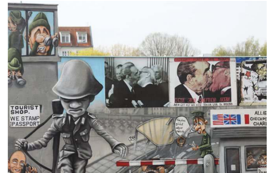
Berlyno sienos fragmentas – puiki atskirties tarp „savų“ ir „svetimų“ iliustracija