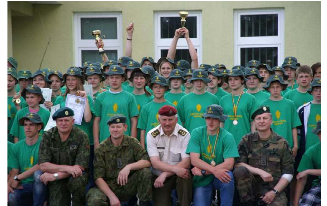
Mūsų daug ir mes – jėga!

Gegužės 30 d. Klaipėdoje, Lietuvos didžiojo kunigaikščio Butigeidžio dragūnų motorizuotajame pėstininkų batalione, prasidėjo XV jaunųjų šaulių žaidynės. Tai tradicinis jaunųjų šaulių renginys, kuriame susirenka sportiškai nusiteikęs jaunimas, pasirengęs ne tik kariškiems iššūkiams, bet ir tiesiog sportiškam pabuvimui.