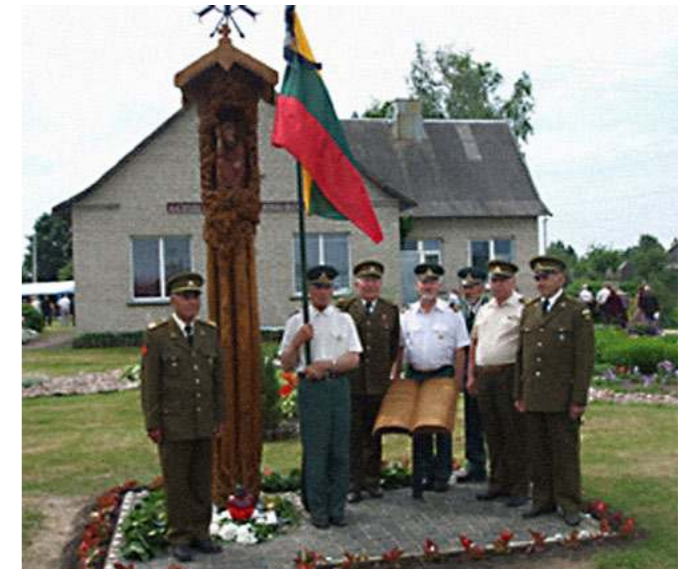
Prie koplytstulpio suplazdėjo žvakių liepsna

Kauno apskr. Vytauto Didžiojo šaulių 2-osios rinktinės Raseinių šaulių 7-osios kuopos vadas