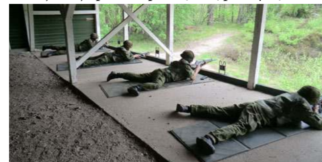
Visų tikslas – tapti geriausiaisiais šauliais

Šaudėme trijose šaudyklose. Smėlio spalvos žmogaus korpuso figūros taikiniai buvo suskirstyti į A, B, C ir D zonas, tačiau iš 300 metrų atstumo neryškiai matėsi. Taikliausieji turėjo per trumpiausią laiką pataikyti į taikinio