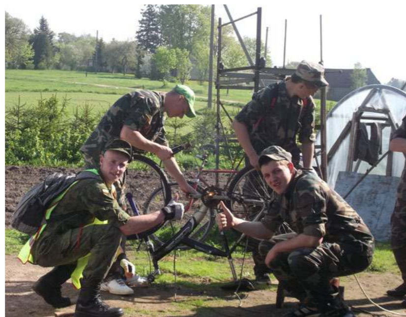
Kelionę toliau trumpam sutrukdė techninė nesėkmė – sugedo du dviračiai

7-osios rinktinės Laukuvos 2-ojo atskirojo būrio jaunoji šaulė