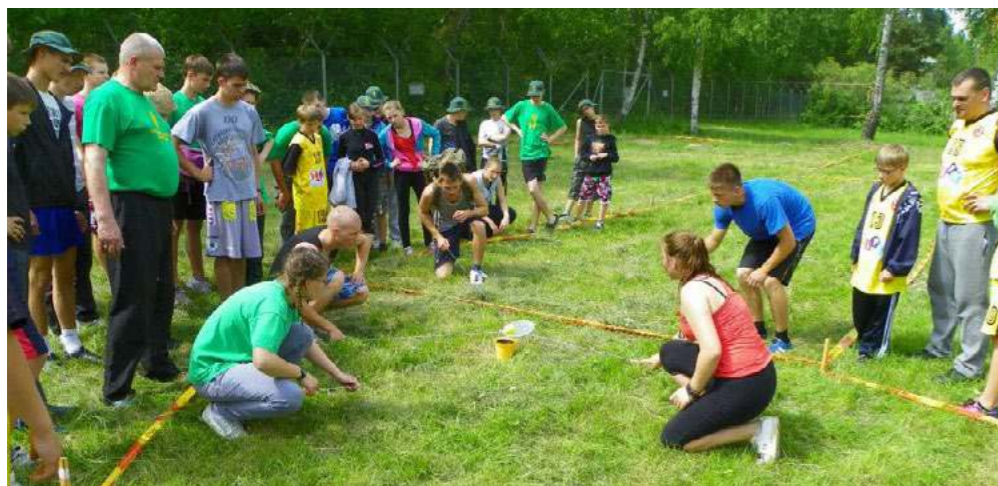
Šioje rungtyje svarbus kiekvieno įnašas