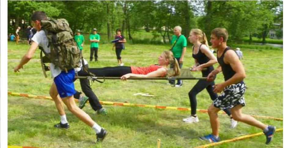
Kai gali pasitikėti draugu – pergalė garantuota