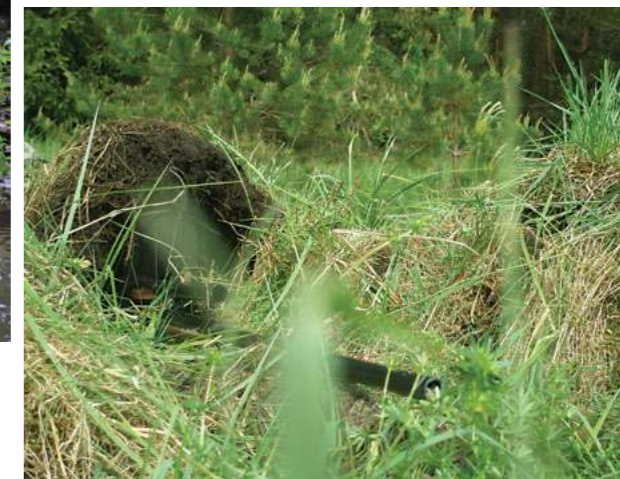
III vieta – Živilė Pacevičiūtė