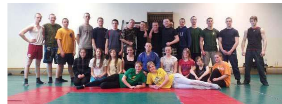
Atėję čia rimtai „dirbame“