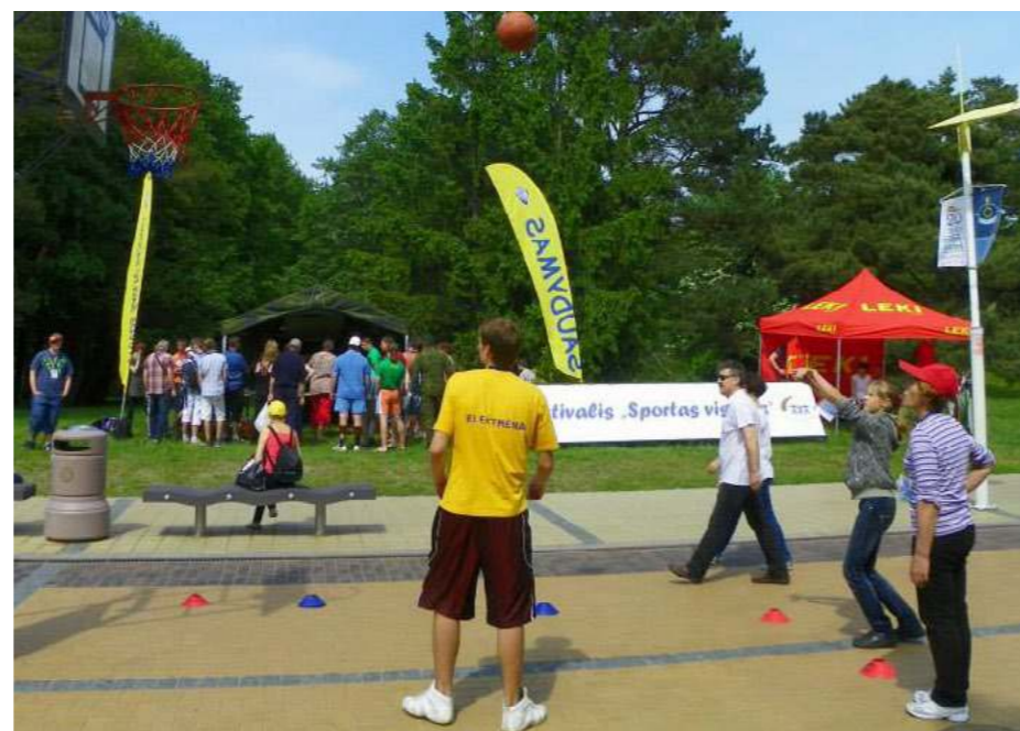
Be krepšinio – nė iš vietos...