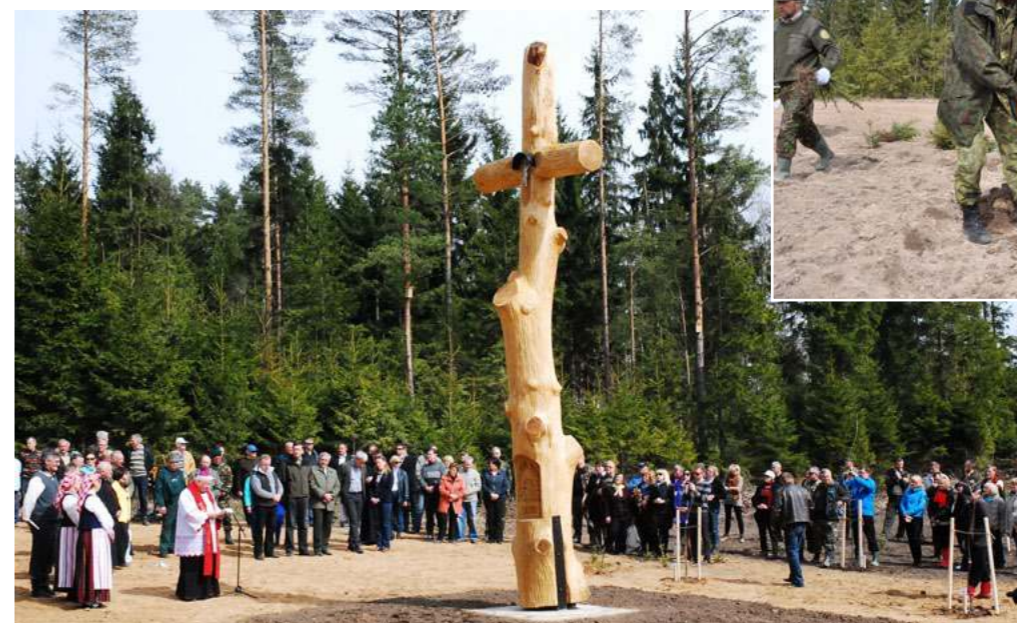
Po keliasdešimties metų čia oš ąžuolynas, primenąs žemaičių krikštą