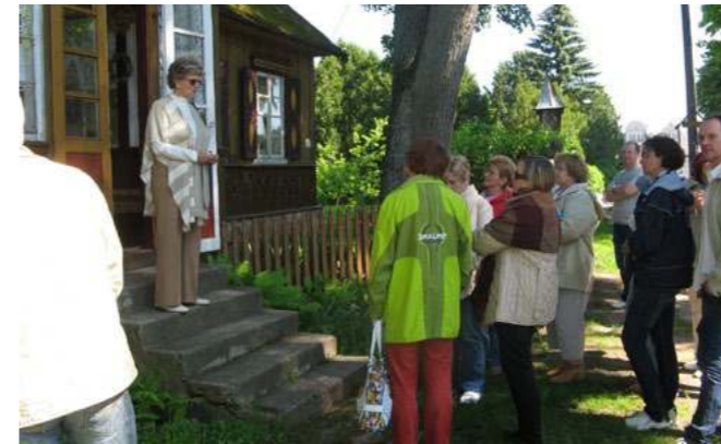
Lietuvių kultūros namuose yra kuo stebėtis

1999 m. birželio 9 d. keliavo popiežius Jonas Paulius II. Lai-vo kajutėje įkurtas nedidelis muziejus, skirtas Šv. Tėvo vizitui atminti. Neskubėdami plaukėme Biale, Necko ežerais iki Studenos (Studzieniczna), pakeliui įveikę šliuzą. Šliuzo įrengimai yra mediniai, atidaromi ir uždaromi rankiniu būdu. Nustebę žiūrėjome, kaip vikriai dirba vienas žmogus juos atidarydamas ir uždarydamas. Išlipdami iš laivo gavome po knygelę, kurioje išsamiai aprašoma kelionė.