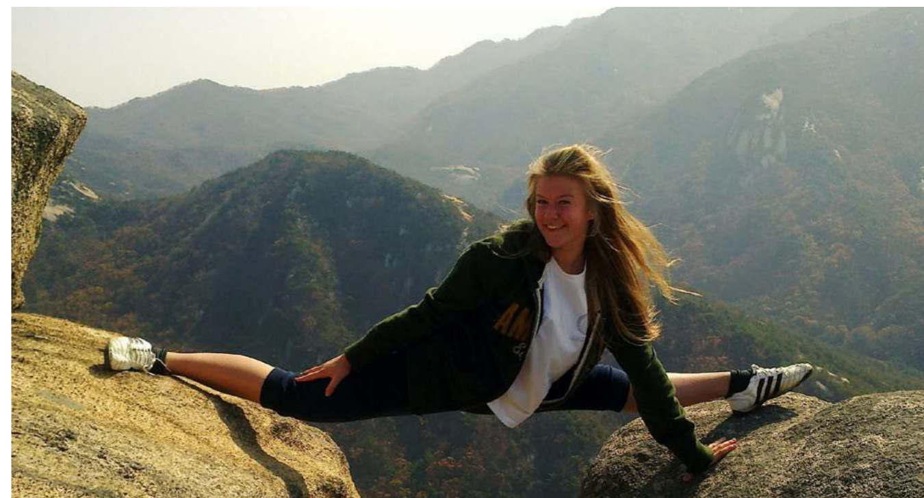
Šokių pamokos nuo trejų metų davė gerų rezultatų

Beje, jų mokymosi sistema yra kitokia, kitokie įvertinimai. Kokius rezultatus gali gauti atitinkamas studentų skaičius apskaičiuojama procentais. Neįmanoma, kad visi gautų 10 (čia A+ ar A). Pvz., 5 proc. iš visos klasės ga-