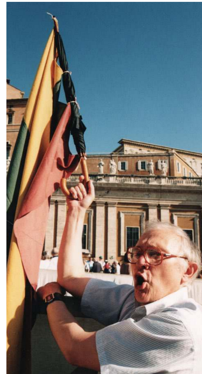
Vatikane su trispalve

Kad ir nelengvas buvo mano gyvenimo kelias, bet esu