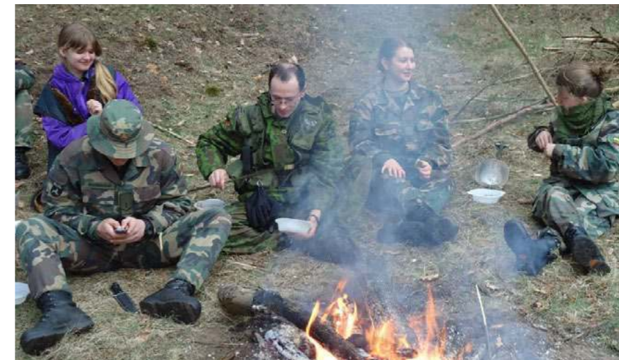
Prie laužo šnekėjoms, ginčijoms...

G razus oras ir pakili nuotaika žadėjo smagų žygį. Pajudėję nuo Radžiūnų piliakalnio staciais ir kojas kertančiais šlaitais ėjome link įdomiosios žygio dalies – nuotykių parko „Tarzanija“, kur šiek tiek jaudindamiesi, bet visi sėkmingai persikėlėme lynais į kitą Nemuno pusę. Nuo čia ir prasidėjo mūsų 40 km taktinis topografinis žygis. Žygio metu naudojome nebylaus valdymo signalais, mokėmės orientuotis pagal žemėlapi, lavinome komandinio darbo įgūdžius. Vakarop pasiekėme tikslą – sodybėlę, kurioje pasilikome nakčiai. Kad vakaras neprailgtų ir prabėgtų naudingai, užsikūrė didžiulį laužą netoli miško šnekėjoms, vakarieniavome bei surengėme viktoriną, taip gilindami savo žinias apie Lietuvos kariuomenę ir jos istoriją. Vėlai vakare sugulę į miegmaišius įmigome kietai, tačiau ilgai pamiegoti neleido „aliarmas“, kuris prikėlė 5 val. ryto.