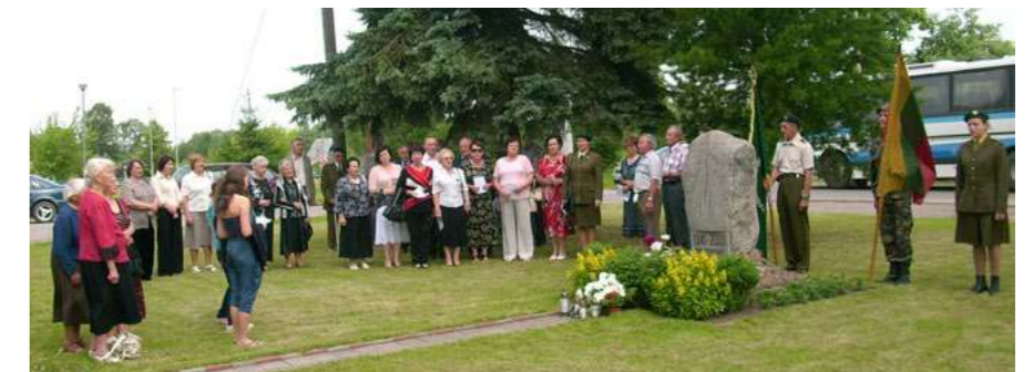
Tuos įvykius primins paminklinis akmuo tremtiniams

Po šv. Mišių Šv. Trejybės bažnyčioje dalyviai ir mes, Pilviškių šaulių 4-osios kuopos šauliai, rinkomės prie Pilviškių geležinkelio stoties, iš kurios tais žiauriaus tremties laikais traukiniais vežė į kančias, nežinia, mirtį taikius, darbščius žmones iš Vilkaviškio, Šakių ir Marijampolės rajonų, aplinkinių kaimų ir miestelių, sugrūstus į gyvulinius vagonus nežmoniškoms sąlygomis. Tuos įvykius primins paminklinis akmuo tremtiniams, prie kurio padėjome gėlių, uždegėme žvakes. Tremtinių dainas dainavo Pilviškių šaulių 4-osios kuopos choras „Jo-