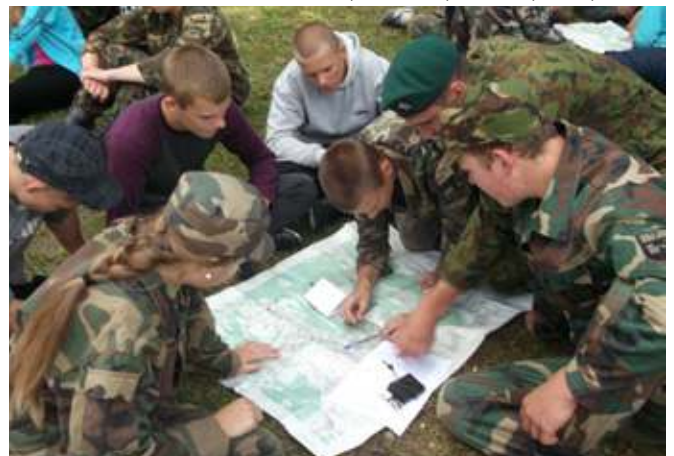
Šauliška veikla suteikia daug vertingų žinių

Tauragės apskr. LDK Kęstučio šaulių 7-osios rinktinės Laukuvos 2-ojo atskirojo būrio jaunoji šaulė