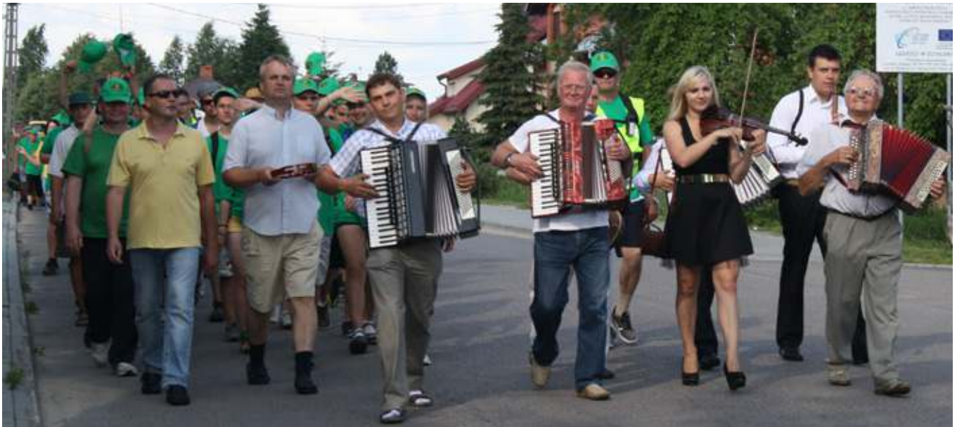
Punskiečiai tautiečius pasitiko džugių