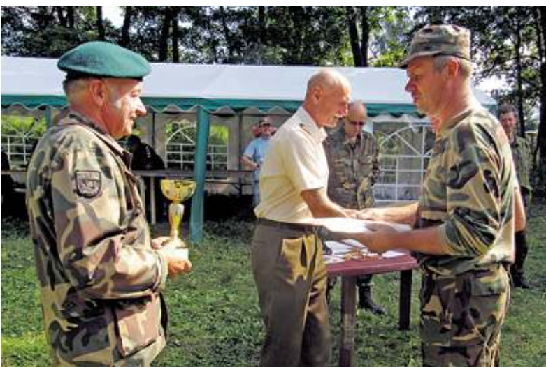
Apdovanojimo metas: kiekvienam pagal nuopelnus