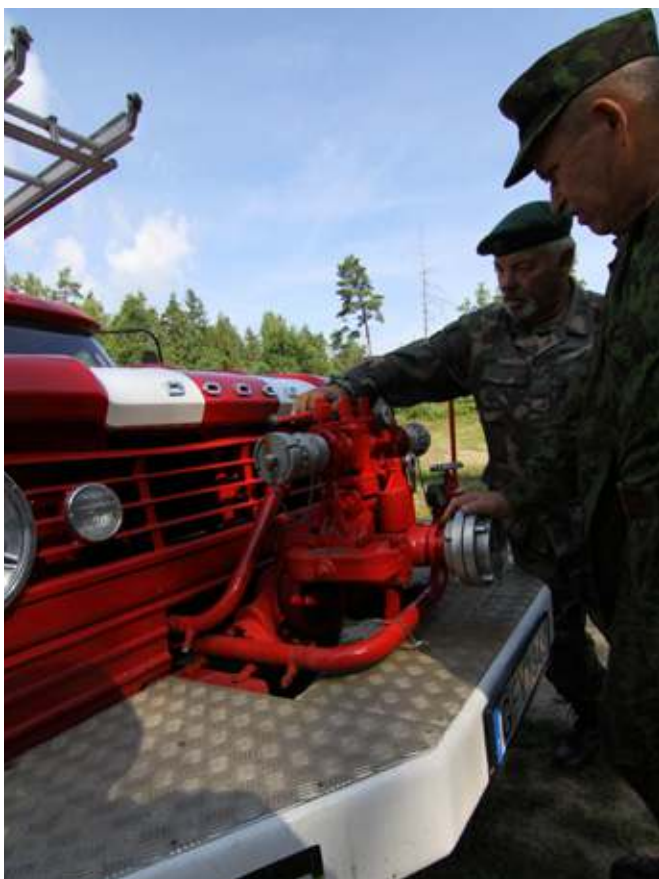
LŠS vadas domėjosi automobilio veikimo principais

Pradėkime iš pradžių – kas gi čia dabar yra? (klausiamo rodydami į garsiai sirenomis kaukiantį, bet akį ne dėl to iškart patraukiantį automobilį).