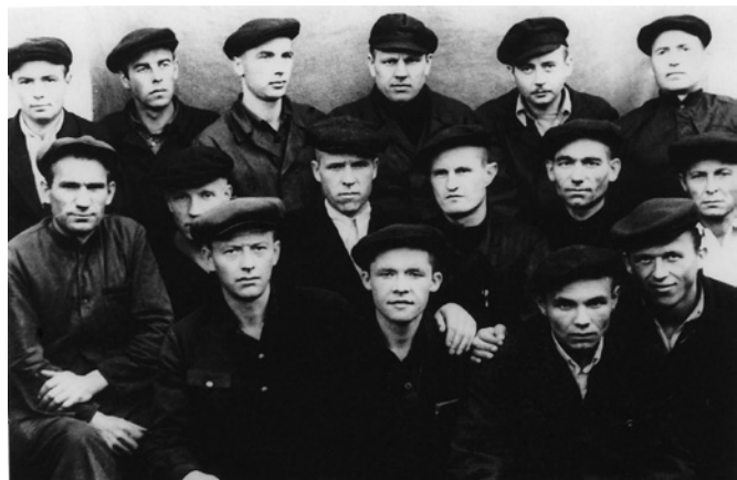
Norilске su likimo broliais. Stovi antras iš kairės

1966-aisiais pasiėmęs mamelę, kuri kankinosi Irkutске, grįžau į Kauną, kur niekas mūsų nenorėjo registruoti. Milicininkai apgaudinėjo ir plėšė: paima 500–600 rublių