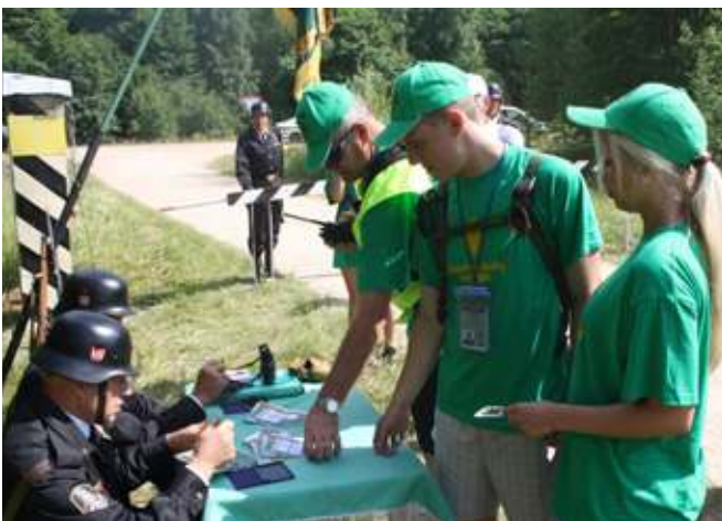
... nes teko „atsižymėti“