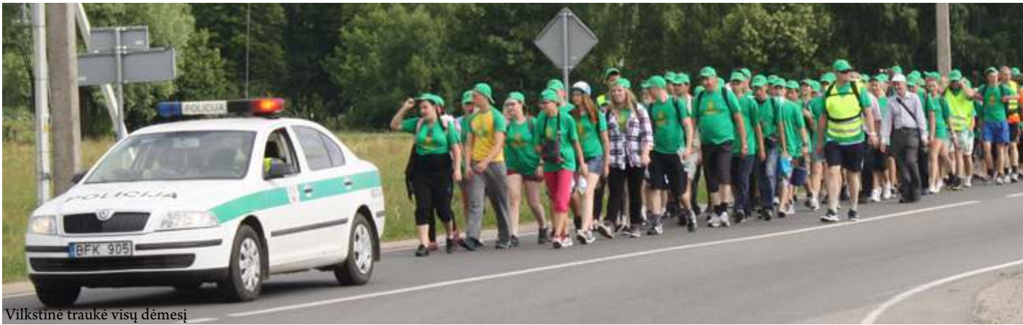
Vilkstinė traukė visų dėmesį

certo, kuriame skambėjo vien tik lietuviškos dainos, ir Punsko jaunimo teatro „Kregždė“ spektaklio apie Romą Kalantą „Ugnies daina“ lygiai devintą vakare Lietuvos ir visai šalia jos gyvenantys lietuviai susikabino rankomis ir iš širdies sugiedojo „Tautišką giesmę“. Tuo vakaras, žinoma, nesibaigė, vakaronė tęsėsi dar ilgai: šokiai, dainos, nesibaigiančios kalbos, vietinių paruoštos vaišės – valandos prabėgo tarsi minutės.