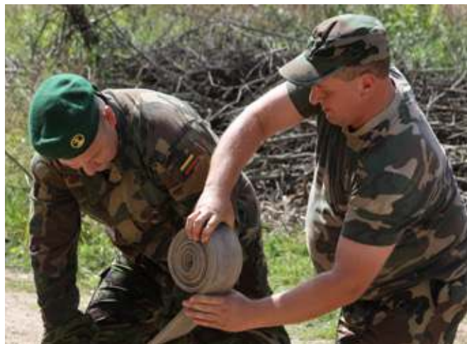
Greitai, greitai – dega! Tiesa, tai tik parodomasis gaisras

T ai Mažeikių šaulių kuopos priešgaisrinis automobilis, kadais „tarnavęs“ Skuodo rajone. Beje, automobilių skuodiškiai tikrai naudojo gaisrams gesinti, jis nebuvo kokia nors „išveiginė“ mašina. Šiandien jos komplektacija dar ne visai galutinė, tačiau pati technika yra tvarkinga: siurblys veikia, kopėčios netrumpos ir dar štai visos žarnos su švirktu. Komanda sudaryta iš šešių šaulių ir jų vadovo. Iš