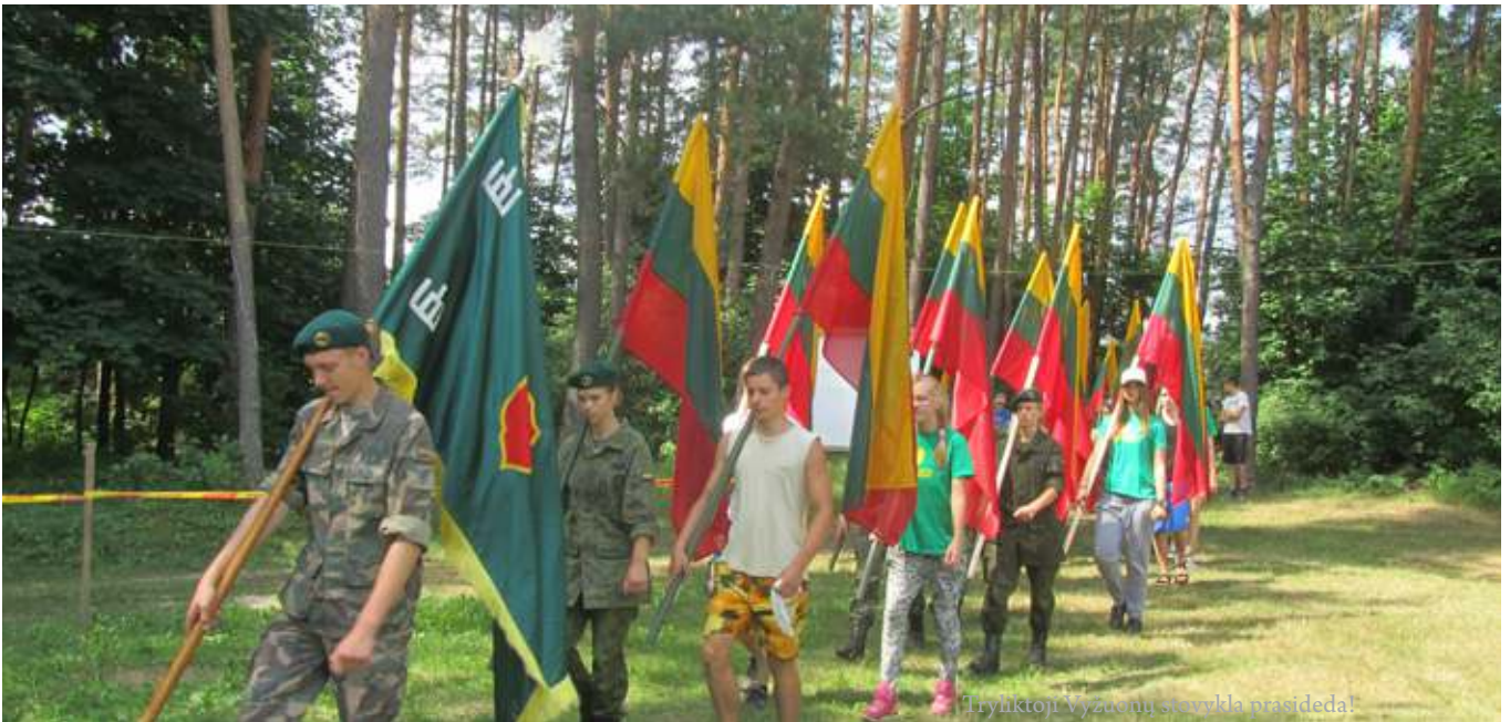
Tryliktoji Vyžuonų stovykla prasideda!