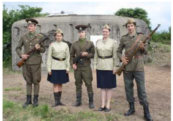
Netoli Raudėniškių kelią pastojo sovietų bunkeris ir „kariai“