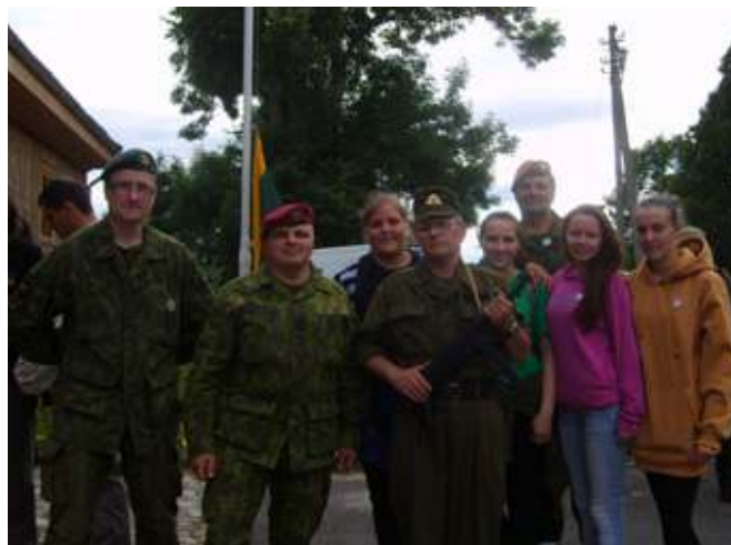
Savanorių idėja priviliojo ne vienos kuopos jaunuosius šaulius

Jau kelintus metus iš eilės Elektrėnų, Abromiškių ir apylinkių kaimų gyventojus vidurvasarį pradžiugina pro jų namus žygiuojančiųjų šurmuly. Šiemet liepos 20-ąją startavo žygis „Žalio velnio takais“, skirtas 150-osioms 1863 metų sukilimo metinėms paminėti ir prisiminti žymaus partizanų vado J. Misiūno–Žaliojo velnio, kuris keliavo po šias apylinkes iš valsčiaus į valsčių su vis augančiu būriu bei naikino sovietų valdžios įstaigas ir aktyvistus, veiklą.