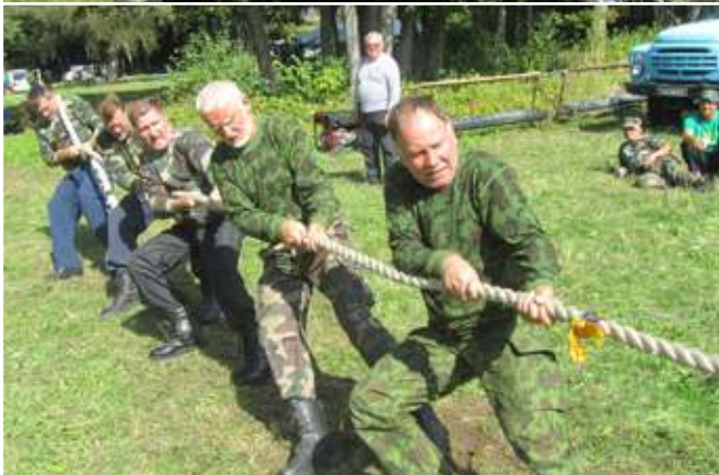
Utenos rinktinės vyrai – pirmosios vietos laimėtojai

Nors draugiškuose susibūrimuose rungtyniaujama ne dėl medalių, smagu juos gauti. Lygiai taip pat džiugu išgirsti, kad šauniai pasirodei. Tokių šauniasių – taikliausių, stipriausių, tvirčiausių... – turime nemaža.