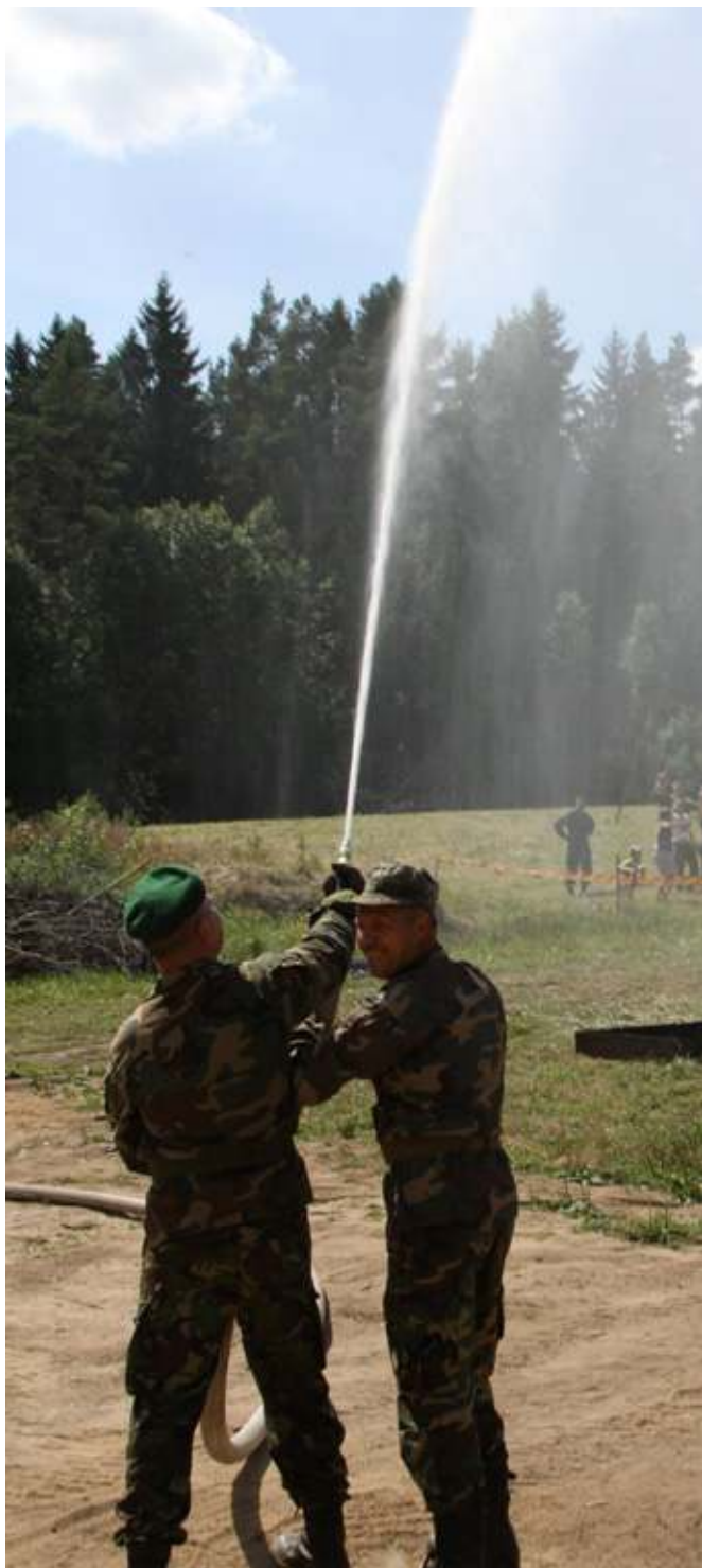
Kovoti su ugnimi mokam