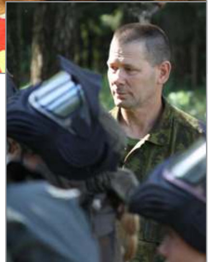
Jaunųjų šaulių vadas visada budrus