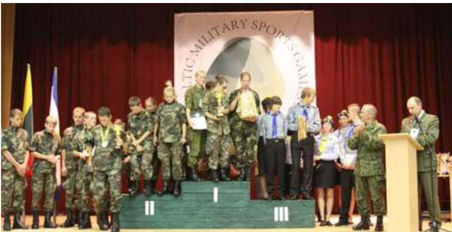
Nugalėtojams plojo ir LŠS vadas

Kitais metais panašios žaidynės vyks kaimyninėje Estijoje.