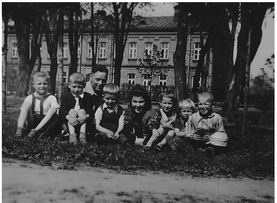
Anuomet Šančiuose su tėveliu, aukle ir kiemo „komanda“