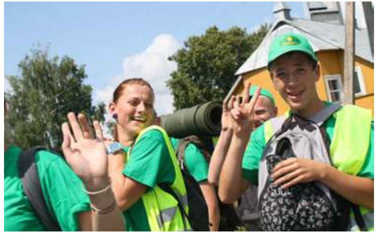
Smagu keliauti geros idėjos vedamiems