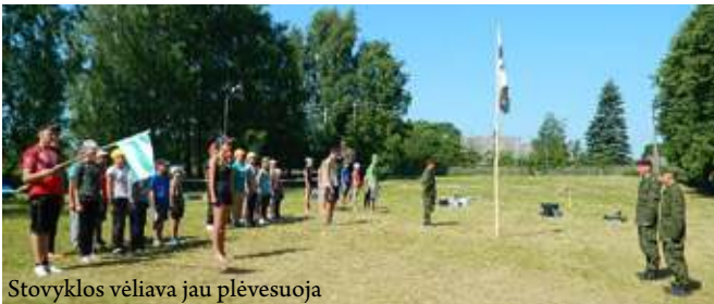
Stovyklos vėliava jau plėvesuoja

Kaip ir kiekvienais metais stovyklų – daugiausia sukarintų bei kelių, skirtų poilsiui, – jaunieji šauliai ir šiemet nestokojo: šiek tiek daugiau nei trys tūkstančiai jaunuolių iš visų dešimties šaulių rinktinių aktyviai leido laiką daugiau ne trisdešimtyje įvairiuose Lietuvos regionuose įkurtų stovyklų. Kaip visi žinome, pati tikriausia informacija yra iš pirmų lūpų, tad ją sužinoję dalijamės su mielais skaitytojais.