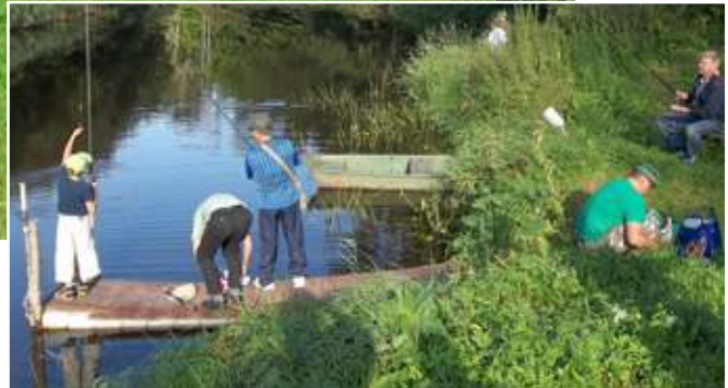
Sąskrydyje niekad netrūksta žvejų