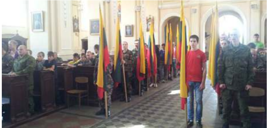
Stovyklos atidarymas – iškilmingas momentas

Į Turgelių mokyklą susirinko šimtas vaikų ir merginų (norinčiųjų buvo daug daugiau, bet galimybės ribotos). Jauniausiam – septyneri, daugeliui – penkiolika ar šešiolika metų. Yra ir buvusių moksleivių, kurie dabar jau šauliai, tarnauja kariuomenėje, policijoje. Jie geri pagalbininkai auklėjant, mokant jaunuosius. Iš kokių mokyklų šie vaikai? Iš Kalesninkų, Eišiškių, Poškonų, Dieveniškių, Turgelių, Šalčininkų. 11-ajai