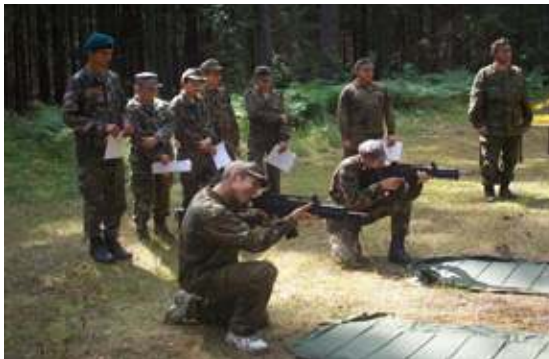
Tai tik vienas iš užsiėmimų