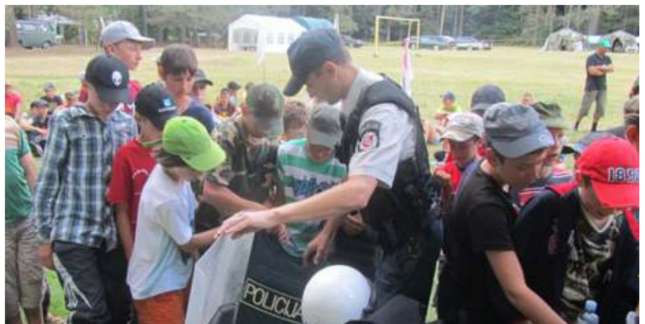
Kiekviena diena – nauji užsiėmimai