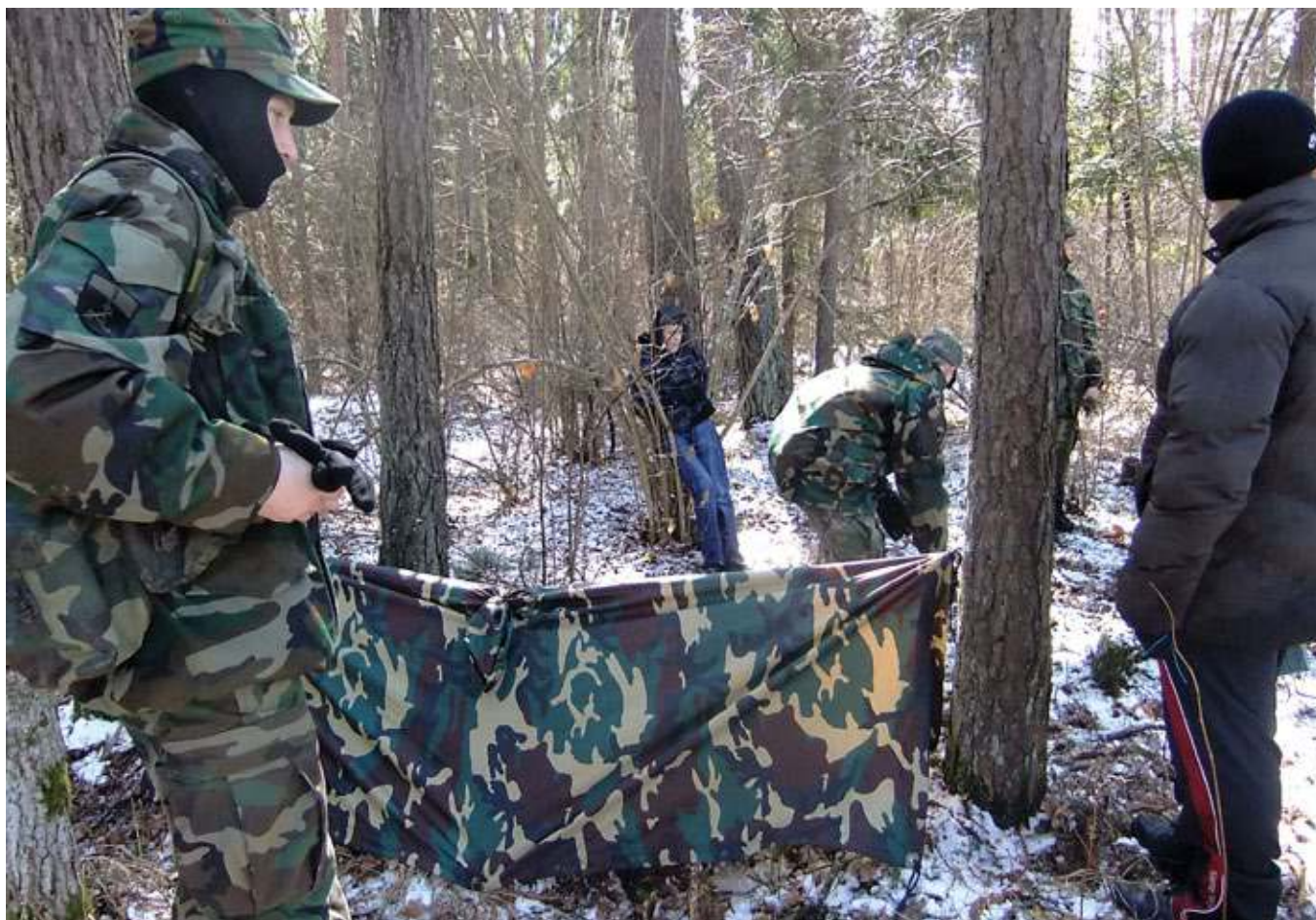
Mokame dar ne viską, bet tikrai daug