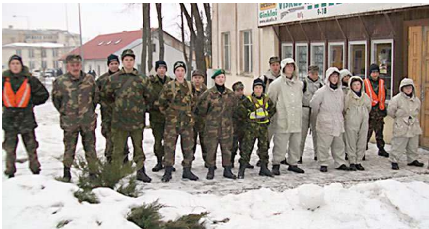
Jauniesiems šauliams blogas oras – ne kliūtis pratyboms

Eidami sugalvojome surengti skyrių varžybas. Pirmoji rungtis – šliaužimas. Greičiausias buvo antrasis skyrius, bet taisyklingiau šliaužė pirmasis. Antroji užduotis – įbėgti į aukštą kalvą, paliesti savo skyriaus vado petį ir grįžti atgal. Abu skyriai bėgo apylygiai, bet pirmasis keliomis sekundėmis pasirodė esąs greitesnis. Finalinė