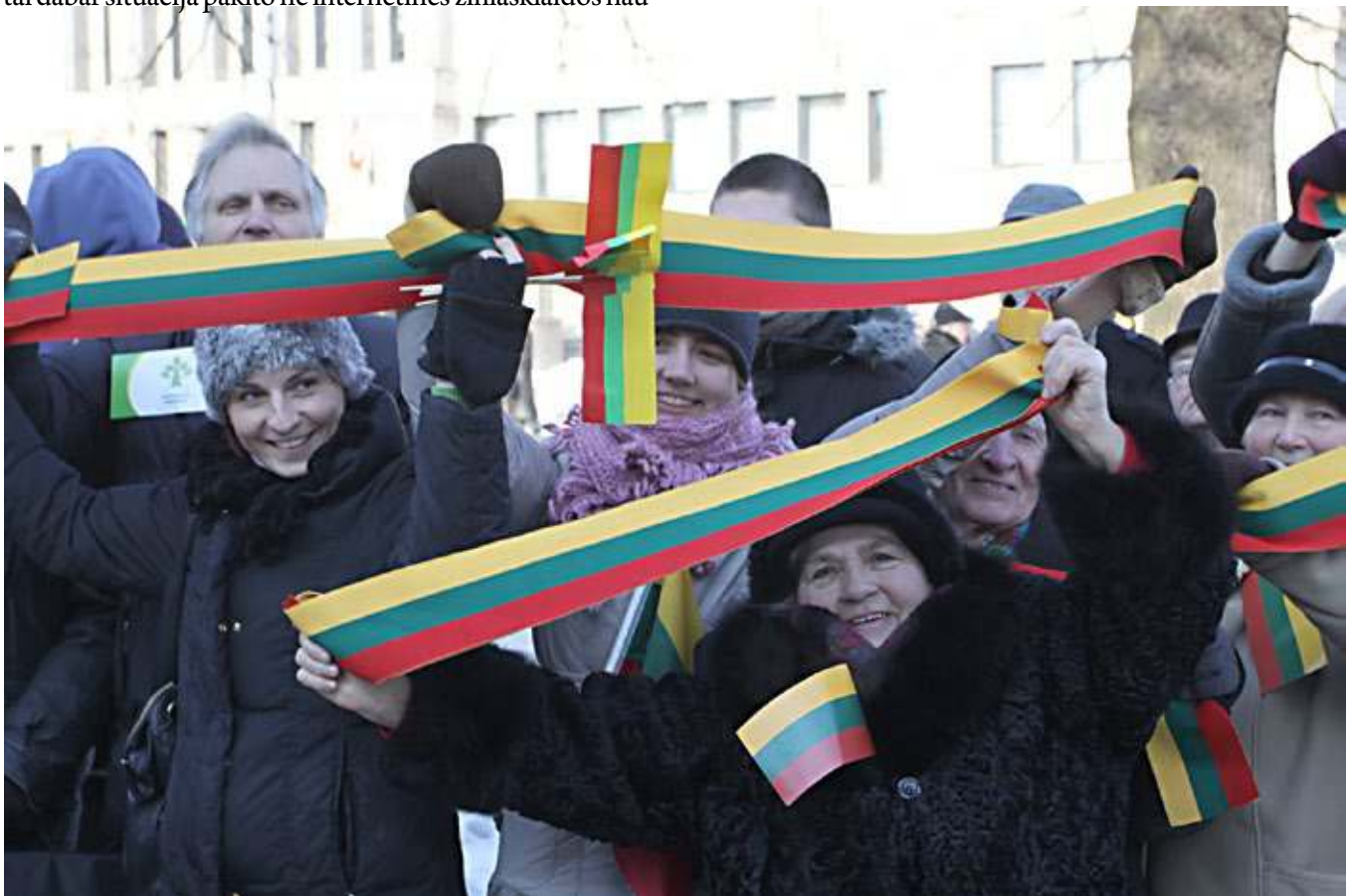
Tautos jėgos rodiklis yra ją sudarančių individų gebėjimas ir noras išlaikyti sveiką, kritinį protą

Ir dar. Nors šį straipsnį pavadiname itin skambiai, netiesiogiai teigdami, kad tautos jėga gali slypėti internete, tačiau tai, ko gero, nėra tiesa. Internetas yra tik vienas iš daugelio galimų ir įmanomų „įrankių“ pasipriešinti vis didėjančiam kvailinimui ir smegenų plovimui. Pagrindinis tautos jėgos rodiklis yra ją sudarančių individų gebėjimas ir noras išlaikyti sveiką, kritinį protą ir nesibaiminti suabejoti tuo, ką teigia net didžiausi valstybės autoritetai. Šnekant paprastai – tikras šaulys visada mąsto savo galva ir nepasiduoda minios ar autoritetų įtikinėjimams. Būtent čia ir slypi tikroji Tautos Jėga.