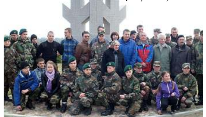
Ir padirbėjome, ir sužinojome