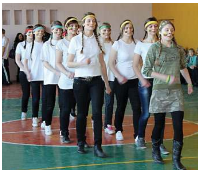
Šauliniai žygiuoja šaunios merginos