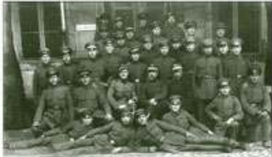
Visi šie vyrai turėjo tikslą – laisvą Tėvynę