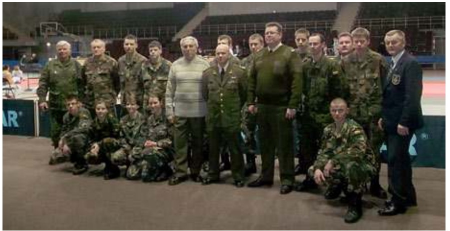
Jaunieji šauliai turnyre prižiūrėjo tvarką, palaikė drausmę