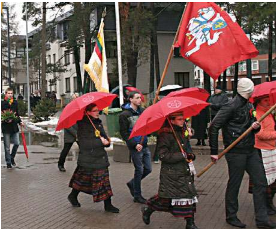
Kovo 11-oji – diena, kai pajunti vienybę su visa tauta