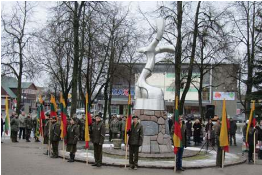
Utenos apskrities jaunieji šauliai matomi ne tik per šventes