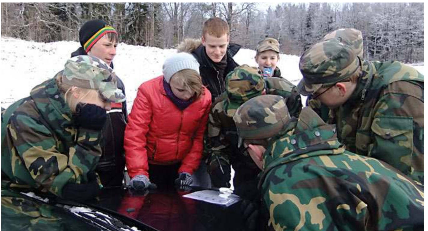
Daug galvų sudėtingiausią užduotį išnarplio