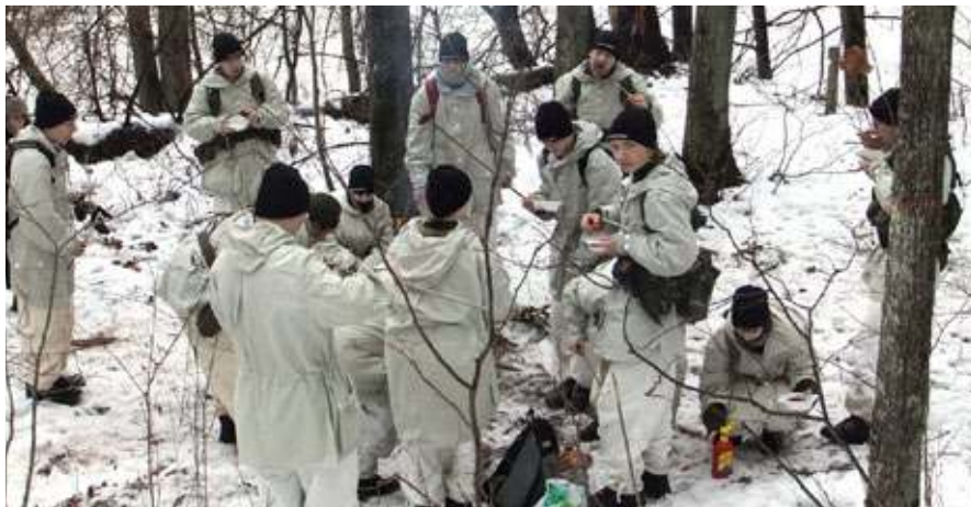
Po pietų – jau atgalios

Žygis neprailgo: netrukus pasiekėme savo tikslą – gražią vietą prie Nemuno, kurioje skaniai papietavo-