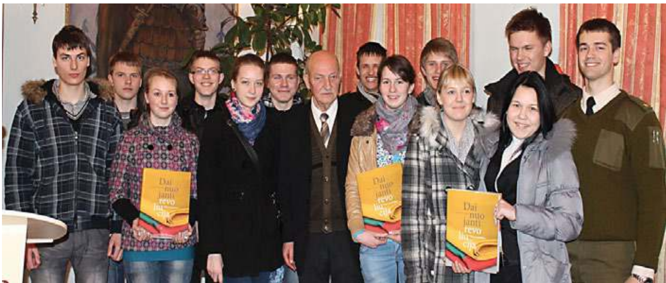
Nusifotografuoti su knygos autoriumi panoro visi alsėdiškiai