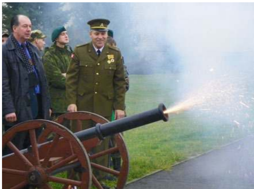
A. Dragūnas džiaugiasi šūviu, skelbiančiu kuopos 10-metį

Per veiklos dešimtmetį, vadovaujant gausiam būriui jaunuolių, – šiandien kuopoje yra 65 jaunieji šauliai – nuveikta ganėtinai daug – jau tai, kad ne vienas šimtas jaunuolių „prisilietė“ prie šaulystės ir įsisaumonino, ką reiškia būti piliečiu ir tikruoju savojo krašto vaiku, didelis vieno žmogaus darbas. Tačiau to Mokytojas neakcentuoja. „Visados dalyvaujame Sausio 13-osios pagarbos bėgime Vilniuje, dviračiais riedame per Lietuvą, leidžiamės į pėsčiųjų žygius ir miname partizanų takais, keliaujame ne vien tik po savo apylinkes, taip pat