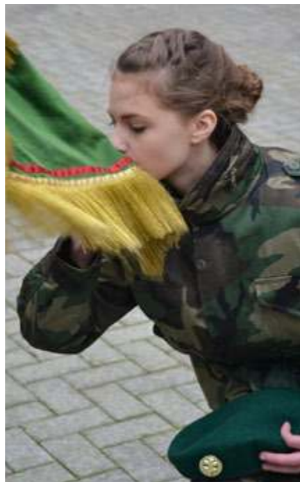
Nuo šiol – šaulė

Po iškilmingos ceremonijos svečiai ir dalyviai galėjo pasigrožėti mokinių piešinių, kolekcionierių antsvivų parodomis ir paskanauti Sostinės šaulių kuopos atstovų išvirta kareiviška koše bei arbata.