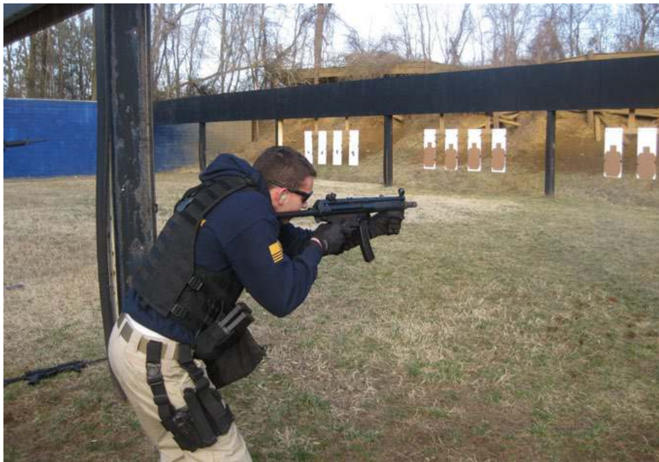
Šaudyti tiek, kiek teko būnant Amerikos Valstijose, ko gero, niekur nebeteks...

Išėjimas į „laisvę“ taip pat buvo ribotas. Priklausomai nuo to, kuriame kurse esi, gaudavome skirtingas privilegijas. Pirmakursiai negalėjo viso savaitgalio praleisti už akademijos ribų, tad jie į miestą išeidavo tik šeštadieniais tarp 12 ir 24 val, antrakursiai jau gaudavo keletą laisvų savaitgalių. Trečiame kurse šios privilegijos dar didesnės,