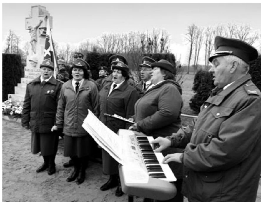
Prie paminklo kritusiems už laisvę skambėjo šaulių atliekamos dainos