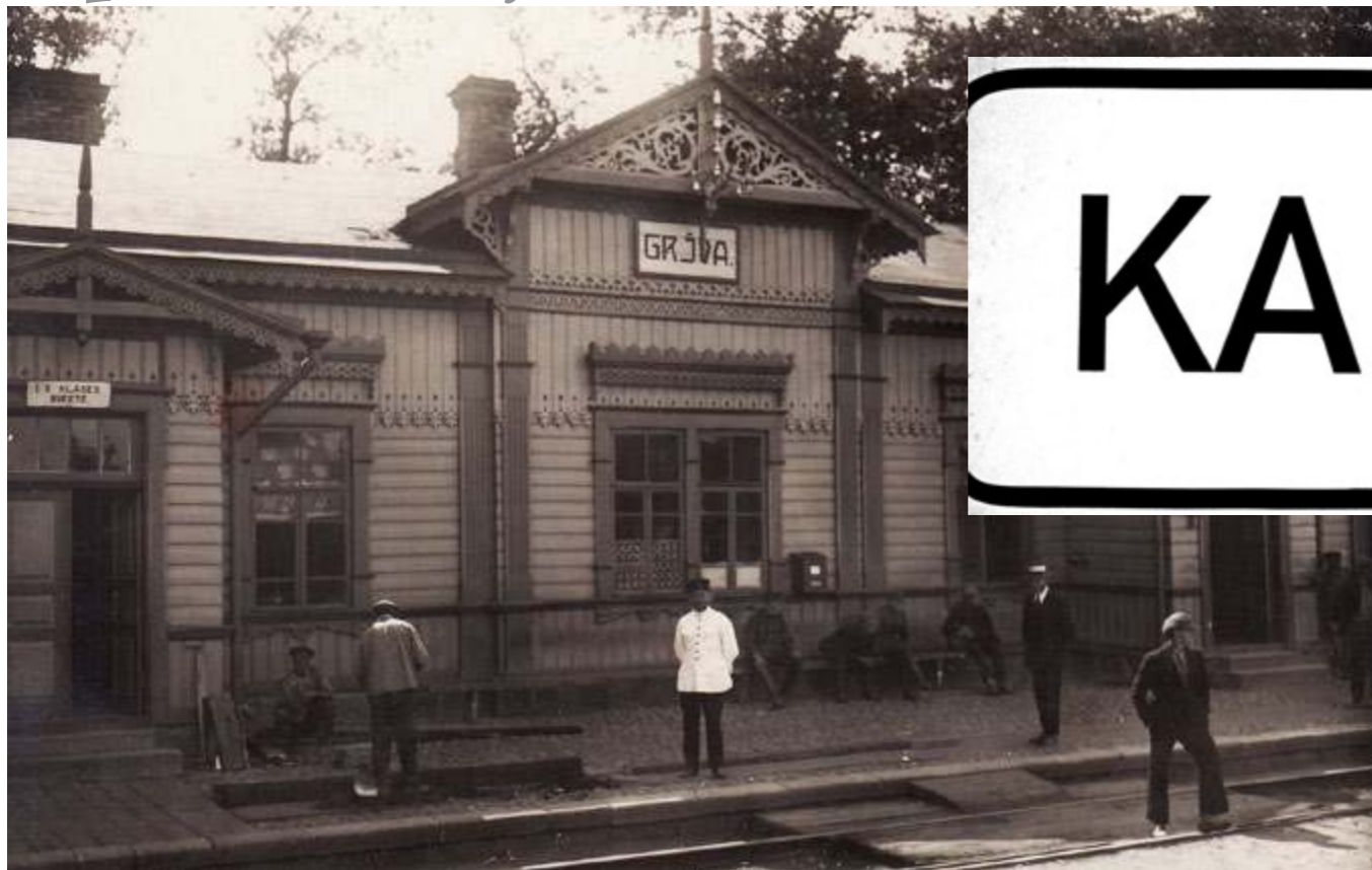
Kaukonių/Grivos geležinkelio stotis. 1926 metai