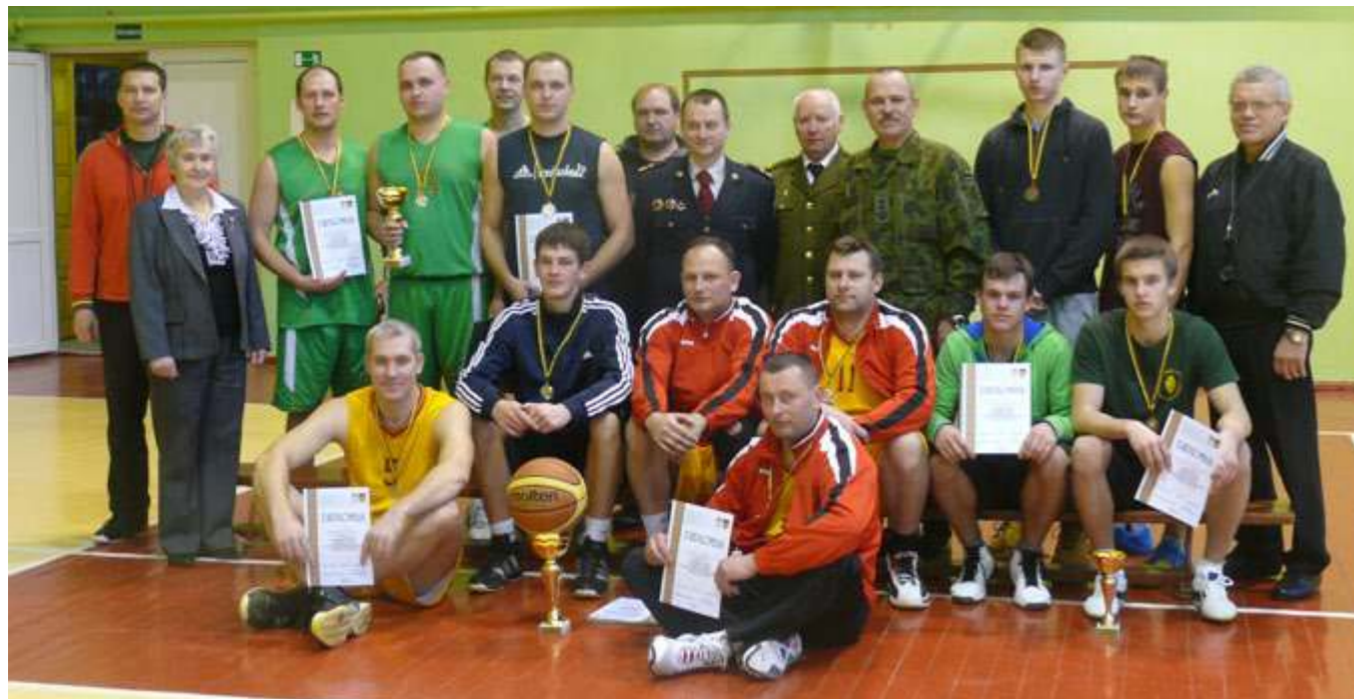
Bendra krepšinio turnyro prizininkų, teisėjų ir svečių nuotrauka prisiminimui