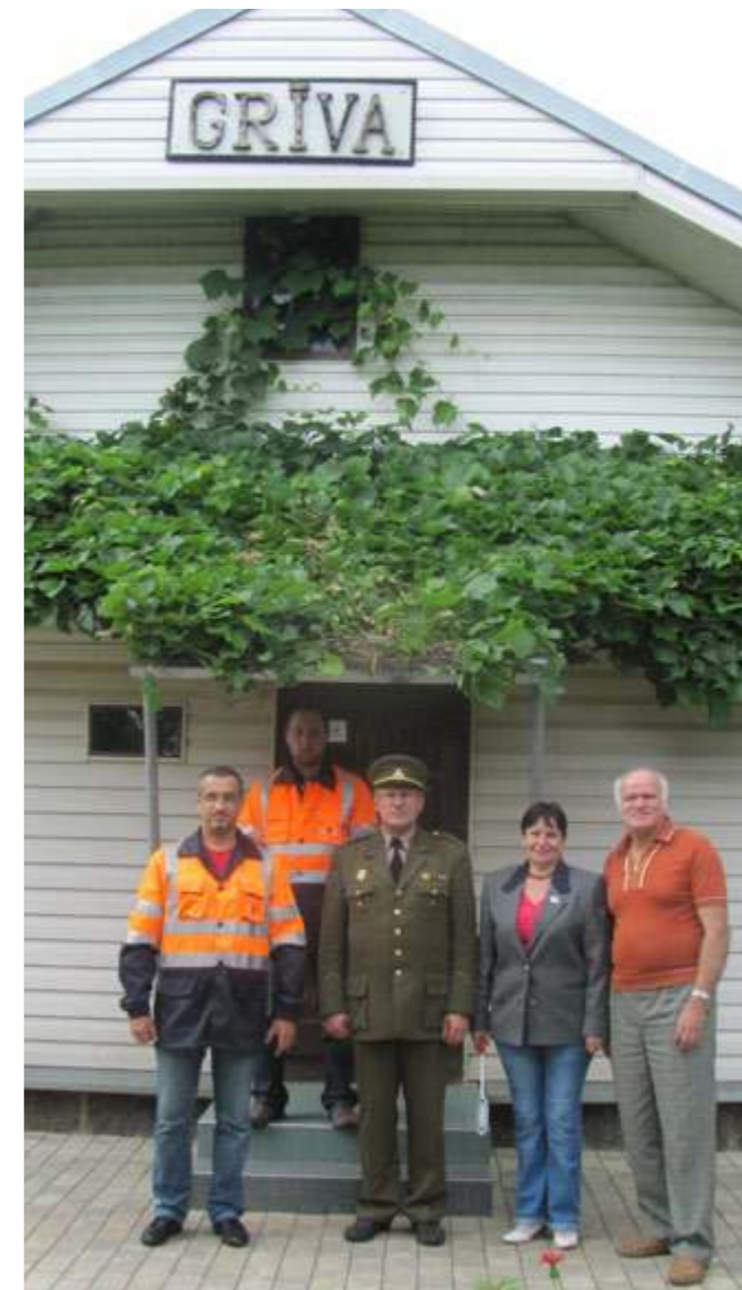
Grivos geležinkelio stotis. Kartu su geležinkeličiais stovi programos „Lietuvos kariuomenės kovos 1915–1940 metais“ dalyviai. 2012 metai

Nuo to laiko lietuvių ir bolševikų kariuomenės skyrė natūrali gamtos kliūtis – Dauguvos upė. Tolesnės kovos su bolševikais virto pozicinėmis. Jos buvo tęsiamos arti-