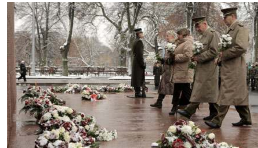
Lietuvos šauliai atidavė pagarbą žuvusiems Latvijos laisvės kovotojams