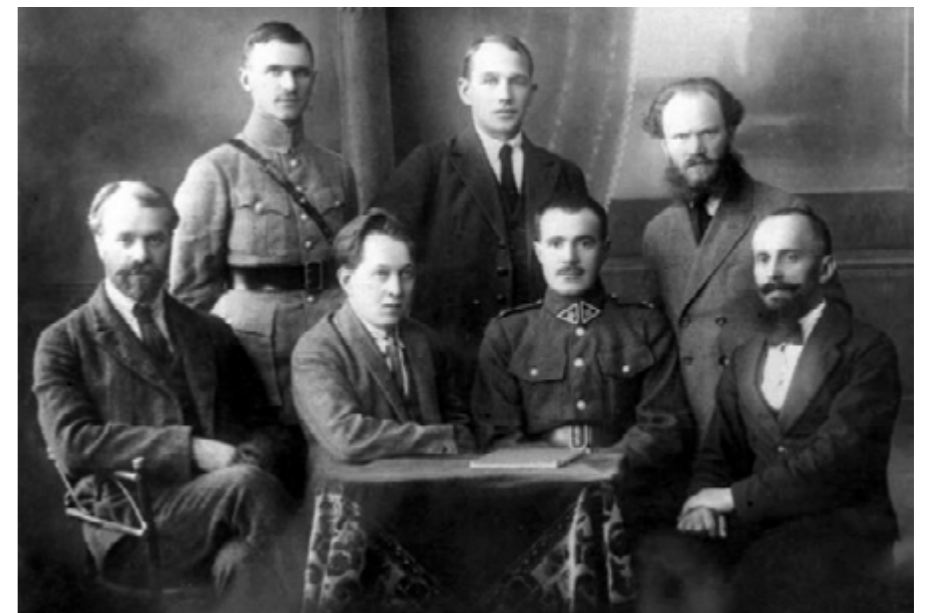
Lietuvos šaulių sąjungos centro valdybos prezidiumas Klaipėdos vadavimo metu. Pirmoje eilėje antras iš kairės – Centro valdybos pirmininkas V. Krėvė-Mickevičius. Kaunas, 1922–1923 m.