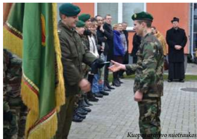
Laukta akimirka – jaunojo šaulio pažymėjimas iš vado rankų