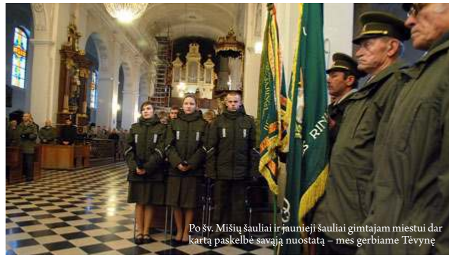
Po šv. Mišių šauliai ir jaunieji šauliai gimtajam miestui dar kartą paskelbė savąją nuostatą – mes gerbiame Tėvynę