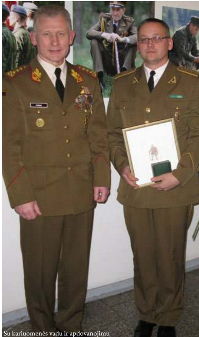
Su kariuomenės vadu ir apdovanojimu

„Labai džiaugiuosi pagreitį įgaunančiu jaunųjų šaulių