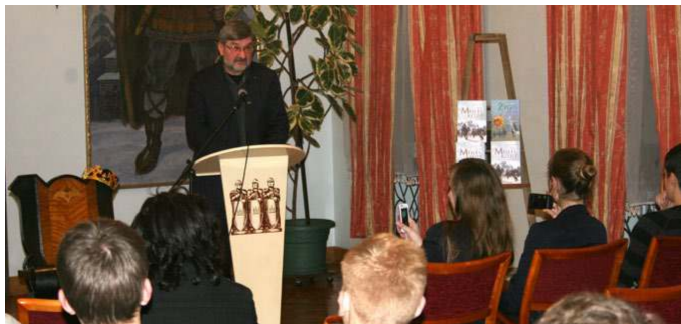
G. Babravičius prisiminė žygių žemaitukais akimirkas