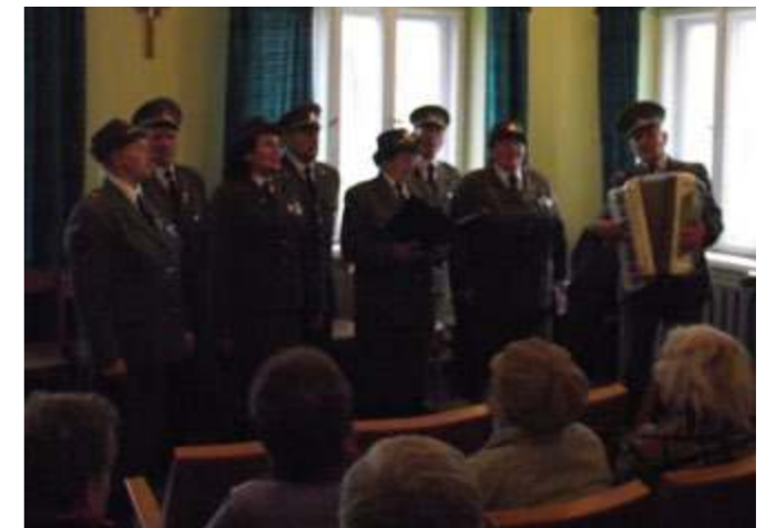
„Bočių ir šaulių“ ansamblis dovanojo patriotinių bei lietuvių liaudies dainų koncertą.