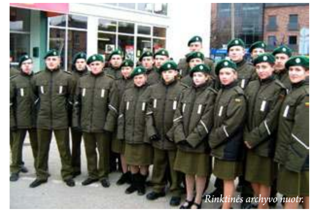
Visados jaučiame brolio ir sesers šaulės petį

Ši diena, manau, svarbi visai tautai, visai valstybei. Kariams, kurie atsakingai ir pareigingai tarnauja mūsų tėvynei, šauliams, kurie ugdo savo tautiškumą ir drąsą, ir visiems Lietuvos žmonėms, kurie kruopščiai ir stropiai dirba savo ir visos tautos labui. Šiandieną, stovėdama ri-