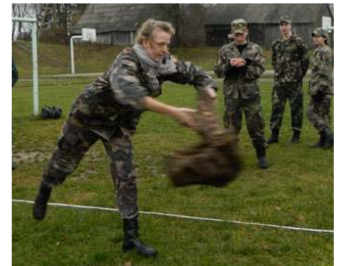
Kelmo metimas – viena iš linksmiausių šaulišku rungtių

Laukuvos šaulių 2-ojo atskirojo būrio jaunoji šaulė