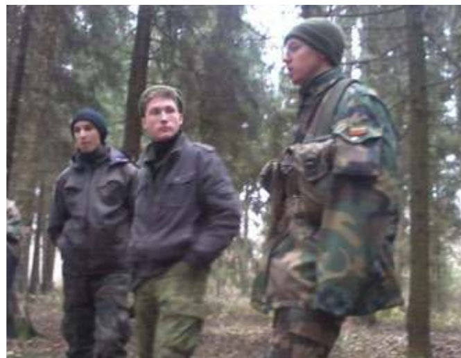
Trumpai atsipūsimė ir vėl pirmyn...