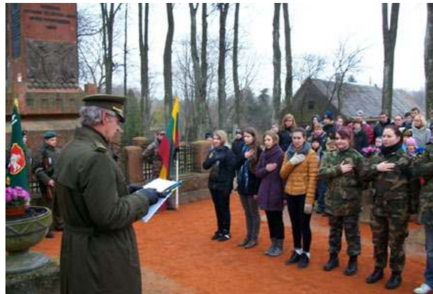
Jaunųjų šaulių pasižadėjimo žodžiai skambėjo nuoširdžiai

Vilkaviškio P.Karužos šaulių 6-osios kuopos vado pavaduotojas