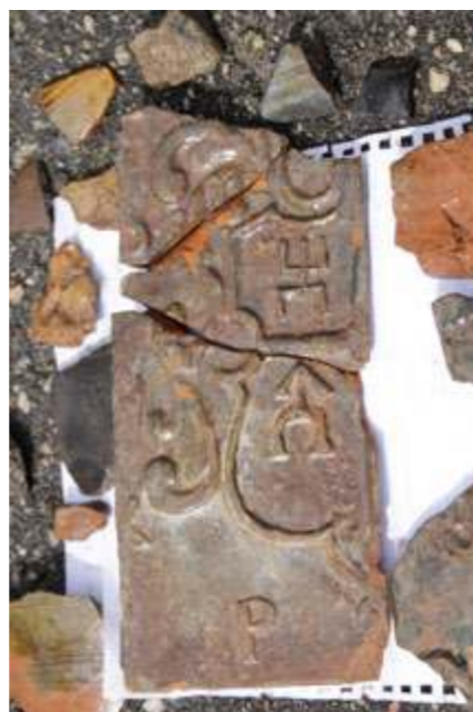
Koklis su Krošinskių herbu

Be šio unikalaus radinio, buvo rasta daugybė keramikos šukių, kitų koklių detalių, buvusių pastatų pamatų fragmentų.