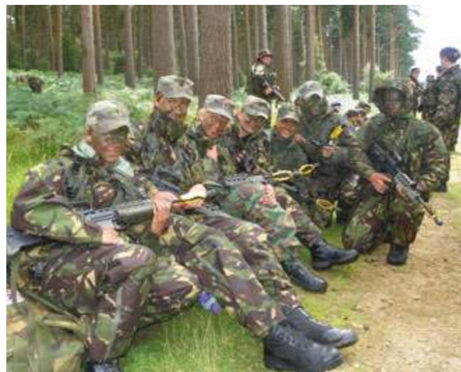
Dalyvavome stipriai pažengusiųjų programoje

Londonė, Lutono oro uoste, lietuvius svetingai sutiko vienas iš stovyklos vadų. Jo lydimi jaunieji jaunuoliai nuvyko į stovyklą (Wretham Camp), kurios pirmas vaizdas pasirodė keistas. Karinis dalinys labiau priminė paprastą vaikų stovyklą, apstatytą mažyčiais nameliukais. Nustebome su-