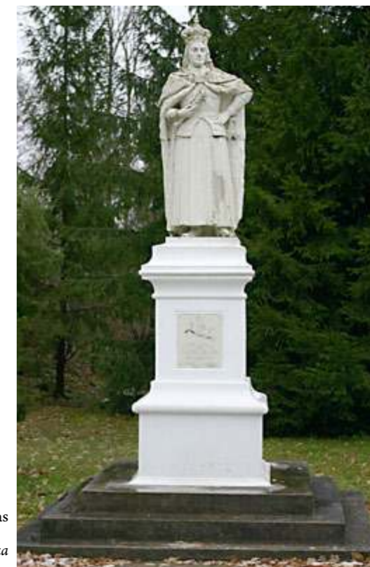
Seniausias Lietuvoje Vytauto Didžiojo paminklas Burbiškio dvare. Skulptorius K. Ulianskis.