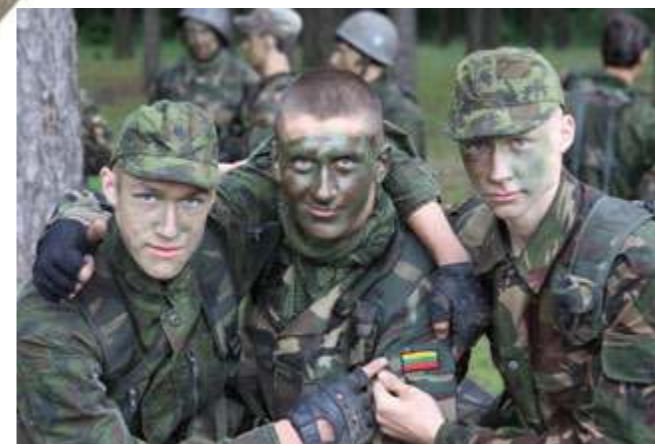
Sunkumai draugystę užgrūdina