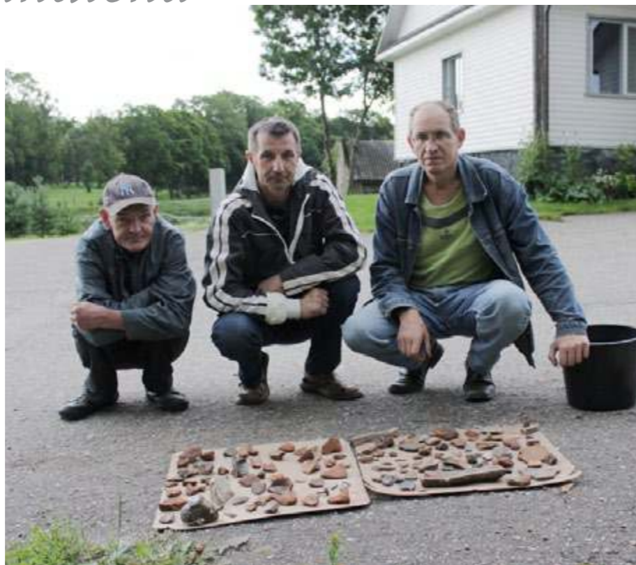
Rokiškio šauliai prie radinio