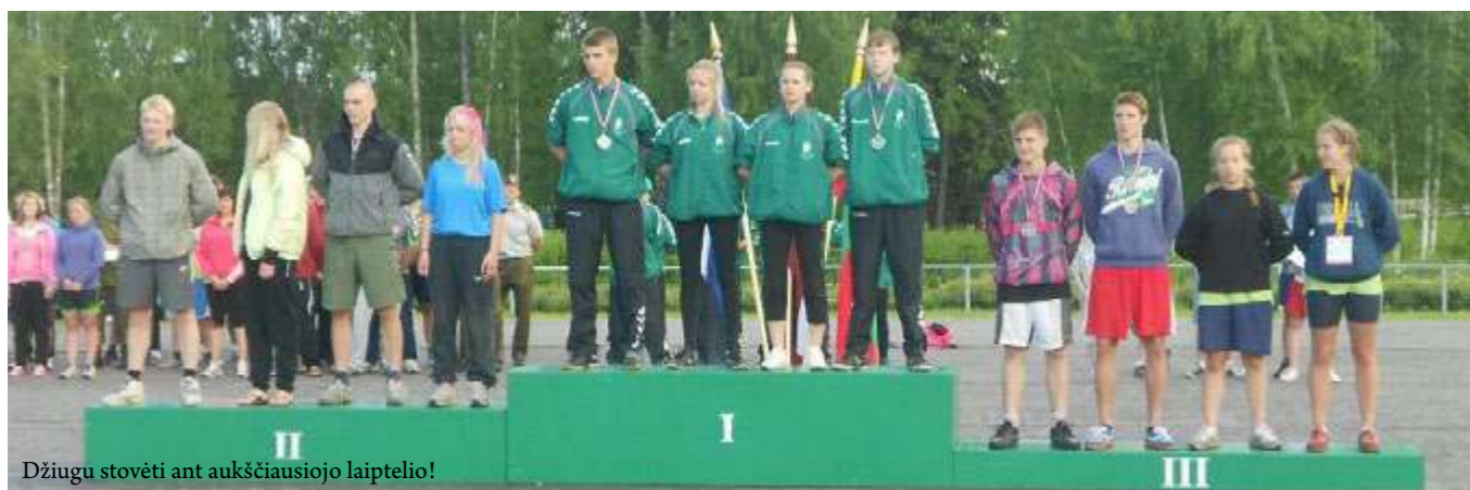
Džiugu stovėti ant aukščiausiojo laiptelio!

Birželio 18-22 d. Lietuvos šaulių sąjungos atstovai – 36 jaunieji šauliai – dalyvavo tarptautinėje stovykloje „Baltic Guards 2012“ (Baltijos sargai, angl.), vykusioje Latvijos istoriniame miestelyje Cesyje. Kartu su mūsų šalies šauliais čia stovyklavo LŠS giminingų organizacijų – Latvijos „Jaunsargi“ bei Estijos „Kodututred“ – atstovai. Iš viso – 126 jaunuoliai.