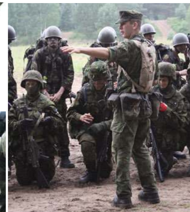
Paskutiniai nurodymai prieš mūšį...