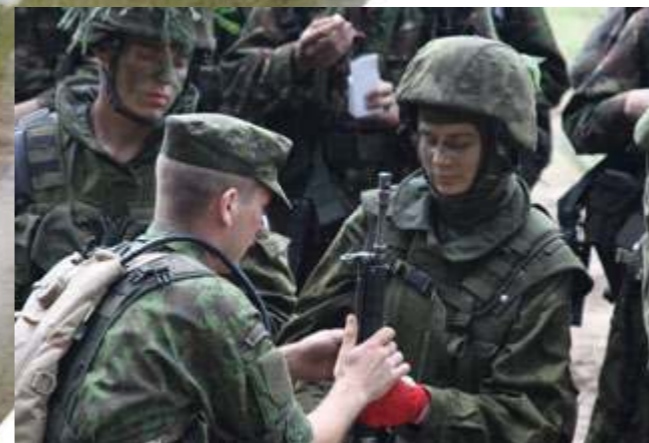
Kariūnų pamokos visada vertingos