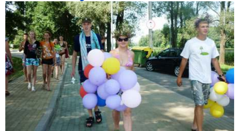
Žaismingose šventėse smagu dalyvauti

rinko vandens dviračius puošti klounais, o valtį – jaunavedžiais.