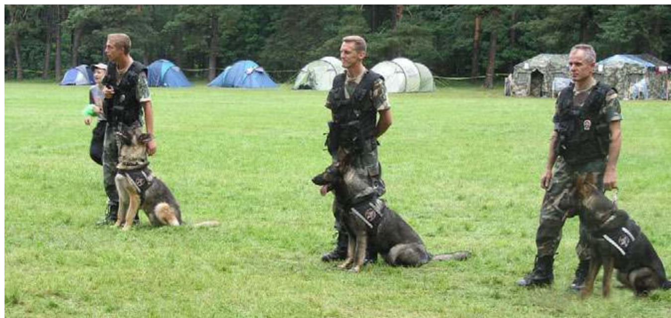
Policijos kinologų pasirodymas visiems buvo labai įdomus

gesinti mokė ugniagesiai, o po pietų viktoriną vedė Utenos sveikatos biuro darbuotojos. Ketvirtadienį visą dieną užsiėmimus vedė savanorių pajėgų atstovai. Iš ryto susipažindinę su teorija, po pietų stovyklautojai išbandė jėgas praktiškai – kariniame kliūčių ruože. Po vakarienės patys ištvermingiausie-