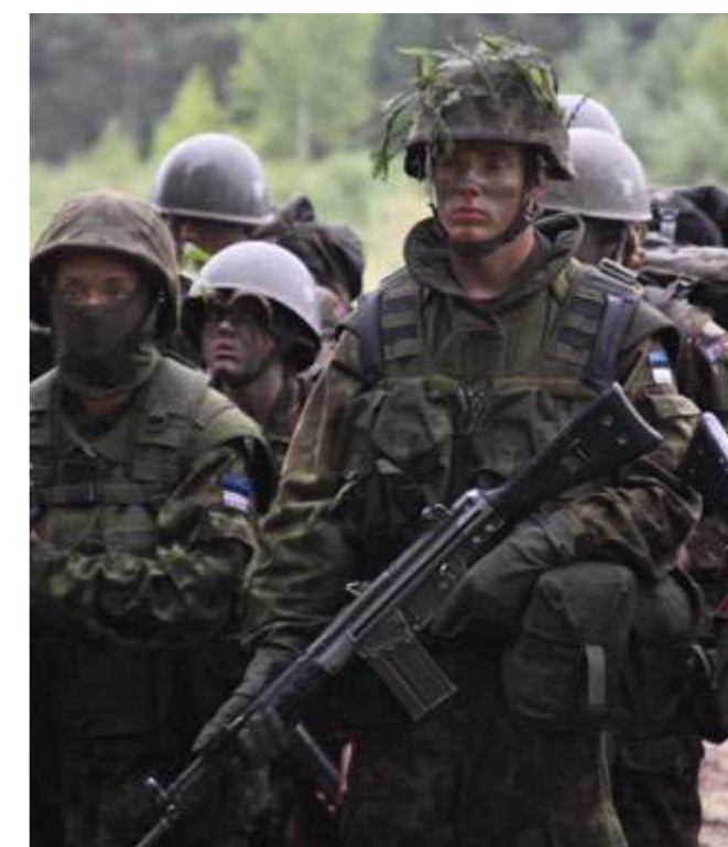
Apie ką svajojate, jaunieji šauliai?