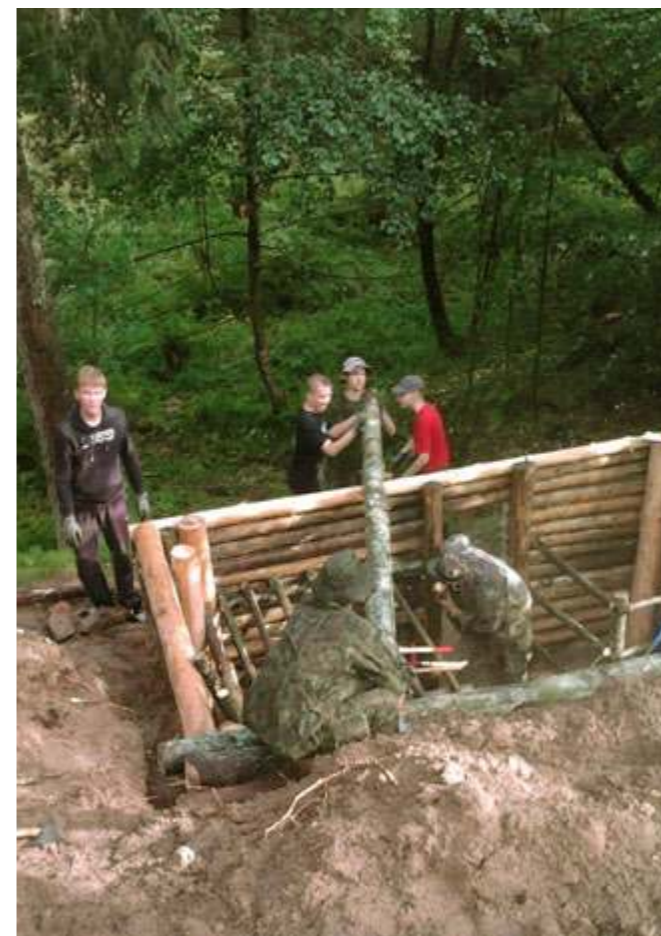
Padirbėti teko iš peties

Per ilgus metus bunkeris apgriuvo, rąstai supuvo, tad jaunieji šauliai nutarė imtis veiklos. Rugsėjo 7-ąją Punios šile jaunimas įsirengė stovyklą ir ėmėsi darbo. Nors gausiai lijo, stovyklautojai dirbo nesustodami: atkasinė-