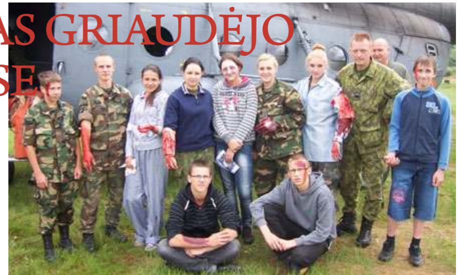
Kad ir „ligoniai“, sraigtasparniu paskraidyti medikai leido

Pratybų tikslas – gelbėjimo darbų treniruotė: dalyvaujančių pajėgų iškvietimas, gaisro orlaiviuose gesi-