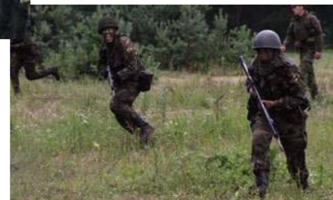
Prasidėjus kovos veiksmams, delsti nevalia