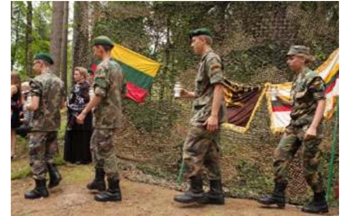
Saugoti partizanų atminimą – mūsų šauliška pareiga

jo bunkerį, pjovė medžius, juos žievino, keitė supuvusius rąstus, kalė gultus ir atlikinėjo kitus darbus. Plaktuko dūžiai, medžių pjovimo garsai bei jaunuolių šūksniai netilo visą dieną. Vakarop darbas buvo baigtas. Jaunieji šauliai susirinko prie laužo, kalbėjo apie partizanus, dainavo partizanų bei liaudies dainas.