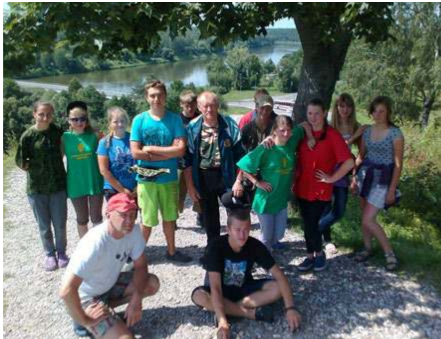
Dzūkijos vaizdai skatino mėgautis vasaros gamtos grožiu

Antroji žygio diena išaušo itin puiki. Iš pat ryto kepino saulė, tad pavargę pusryčius, nieko nelaukė, pasileidome pasroviui. Pietums sustojome sename Perlojos kaime. Ten apžiūrė-