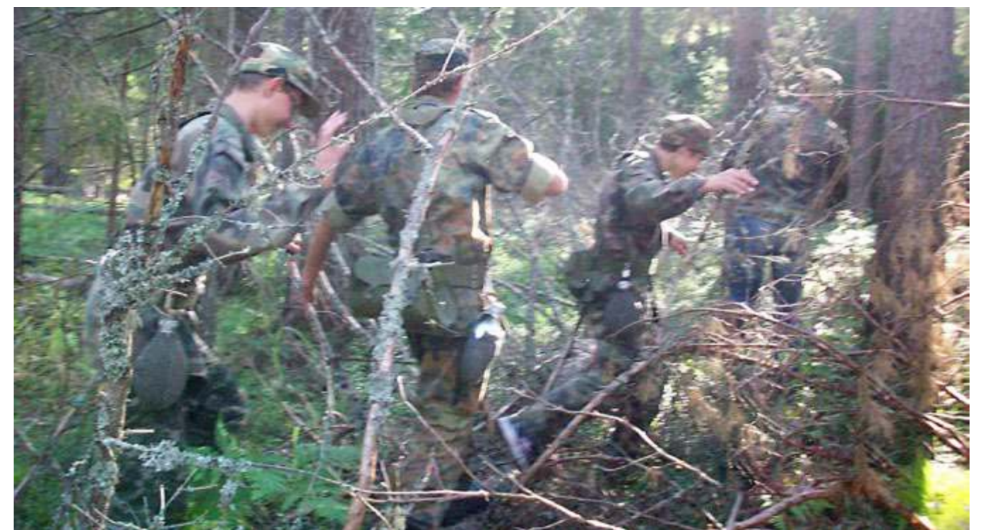
Penki kilometrai nėra daug, tačiau ne mišku keliaujant

Rokiškio jaunųjų šaulių 9-osios kuopos vadas