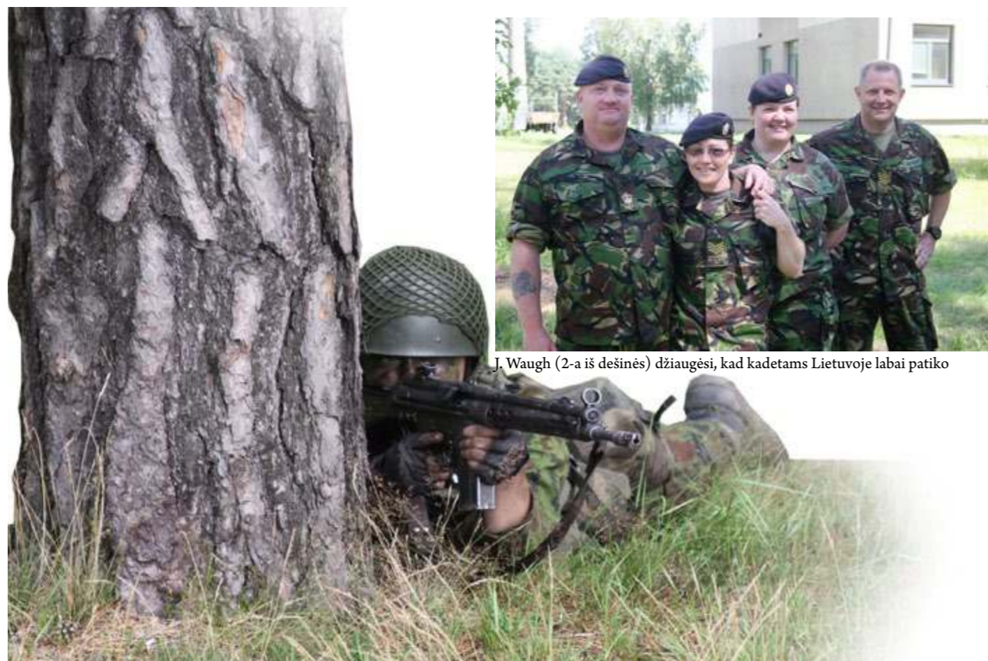
Susikaupęs, tailus, žinant, suprantas...