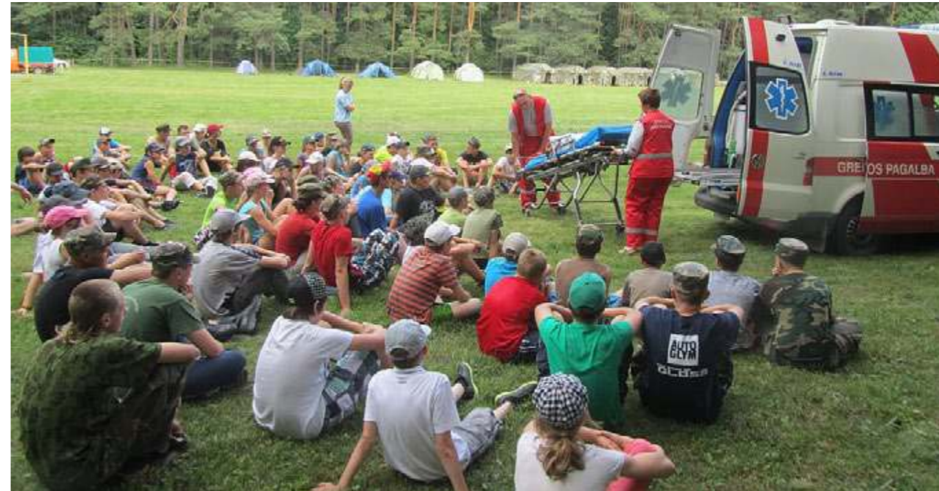
Jaunajam šauliui reikia žinoti, kaip suteikti pirmąją pagalbą